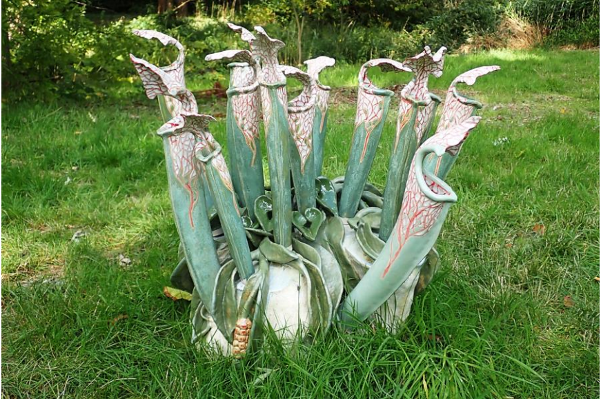
'De trompetbekerplant' van Yvonne Mollee.