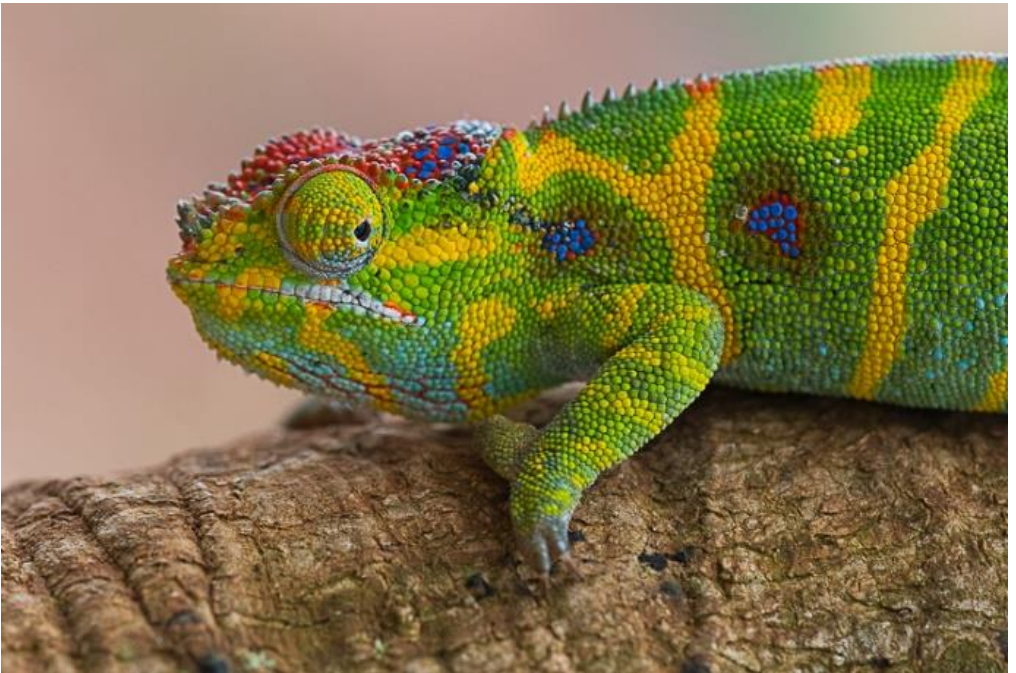
Een 'ministeck kameleon' op Madagaskar.