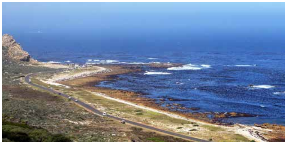
Uitzicht op Kaap de Goede Hoop

Voor de mensen die de komende avond 10 september naar Piet Hoogers gaan: