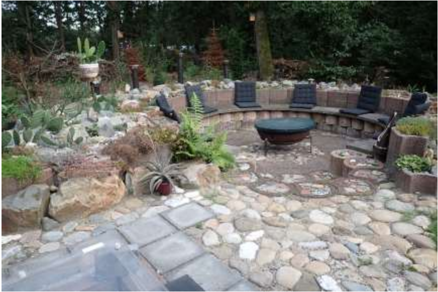
De bijzondere zitkuil.