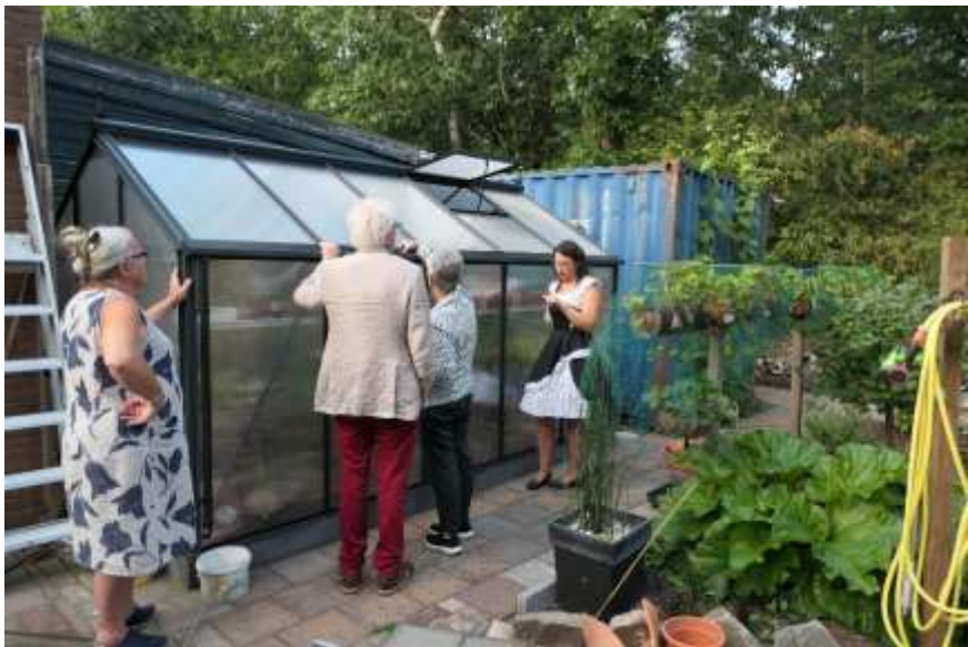
Inspectie van de dakgoot van het kasje.