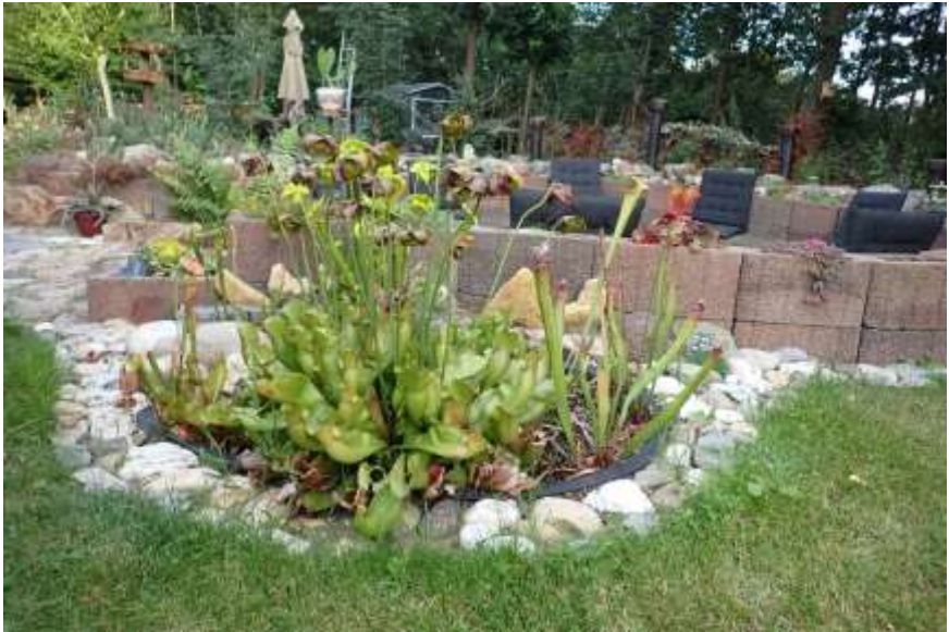
De 'vijverbak' met vleesetende planten.