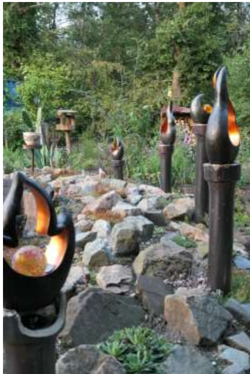
De aparte verlichting op zonnecelletjes.