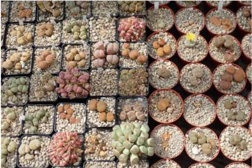
Een flinke collectie hoogsucculente mesembryanthemums.