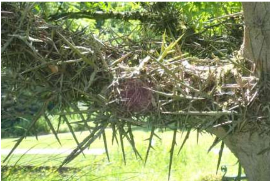
Een tak van de angstaanjagende Japanse valse Christusdoorn, Gleditsia japonica .

Fietsend in Kerkrade kwamen we zomaar langs een botanische tuin en we besloten de laatste dag te reserveren voor het bezoek daaraan.