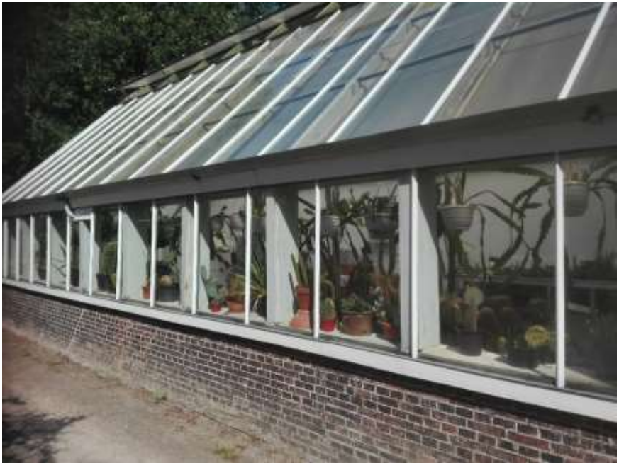
De kas, voorheen de oranjerie, van het landgoed.