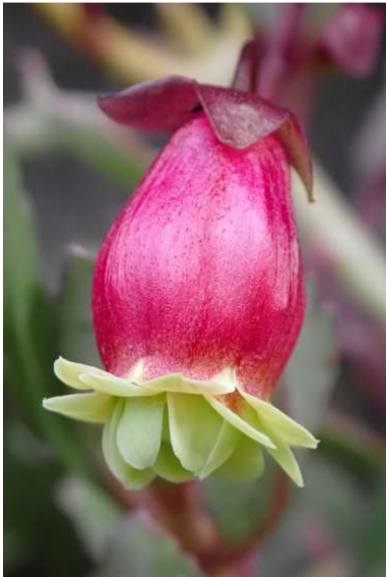
De plant met deze bloem staat bij Mireille in de 'open haard'.