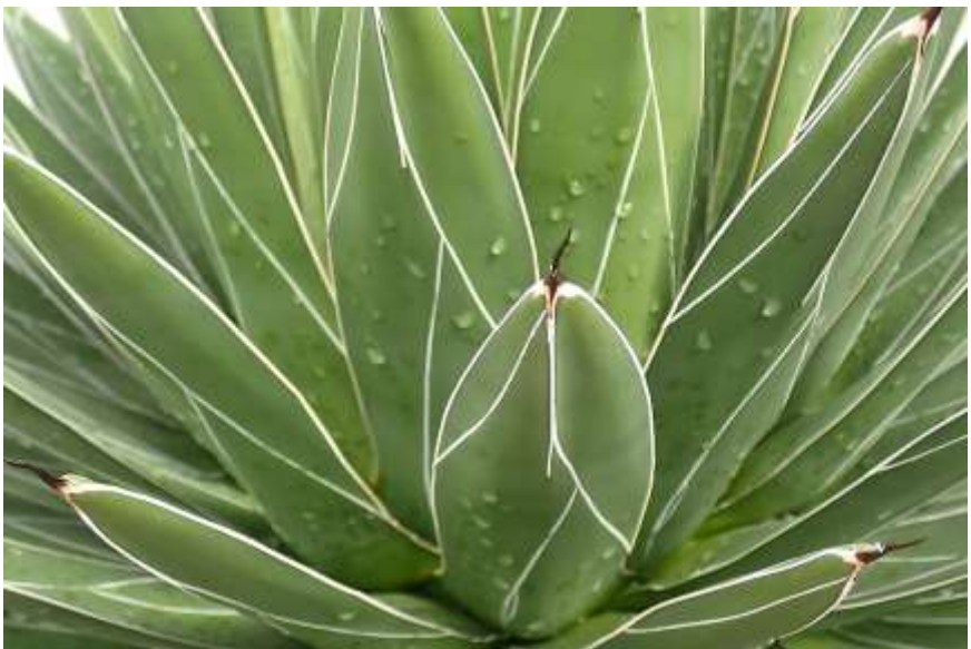
Een fraaie Agave victoriae-reginae .