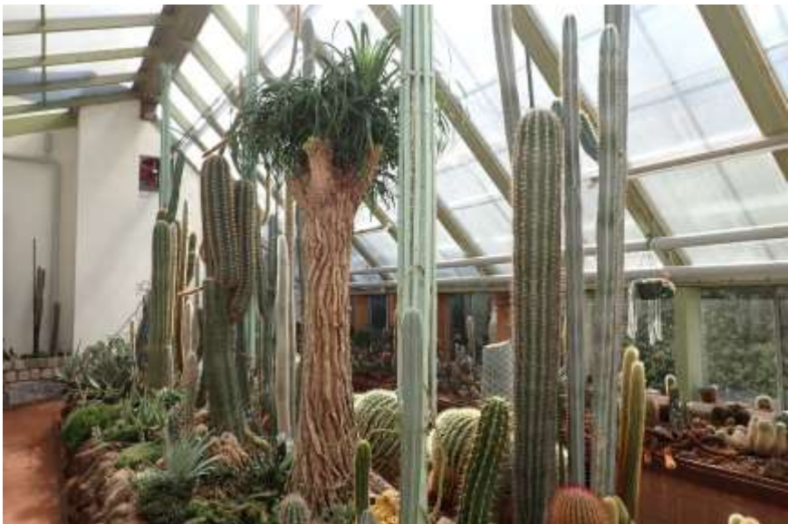
Een kijkje in de kas.