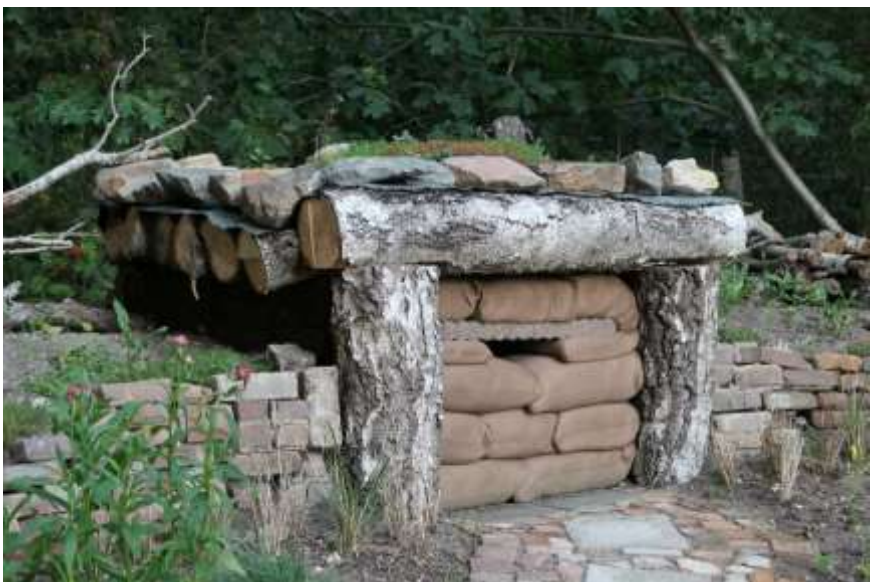
Of de vleermuizen hier komen wonen is de vraag.