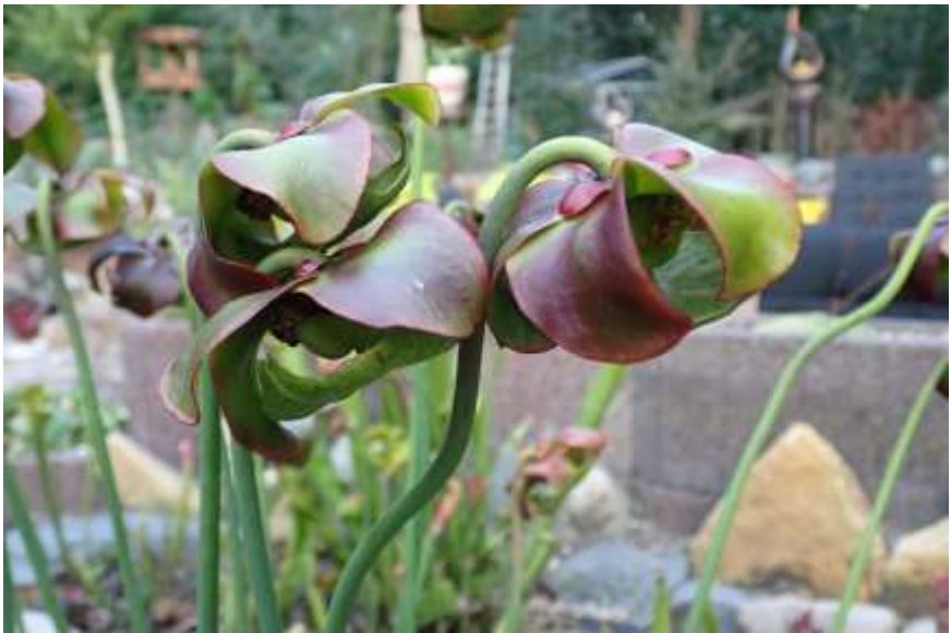
Een bloeiende bekerplant in de vijverbak.