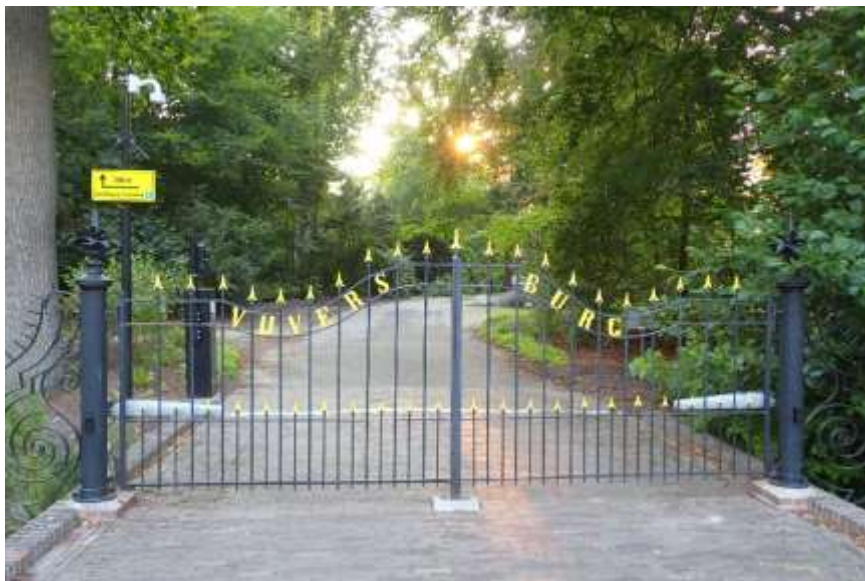
De oude toegangspoort naar het landgoed.

We kwamen een jonge vader met zoontje tegen. Hij, de vader, droeg een grote zuilcactus. Trots zei hij 'De heb ik net voor heel weinig geld in de cactuskas gekocht. Maar de kas is nu gesloten'. De teleurstelling was merkbaar bij de partner. Toch maar verder op zoek naar de kas. Misschien toch nog open? Gelukkig stond de kasmedewerker te praten met een bekende en konden wij er