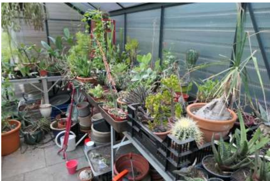
Een kijkje in de kas.