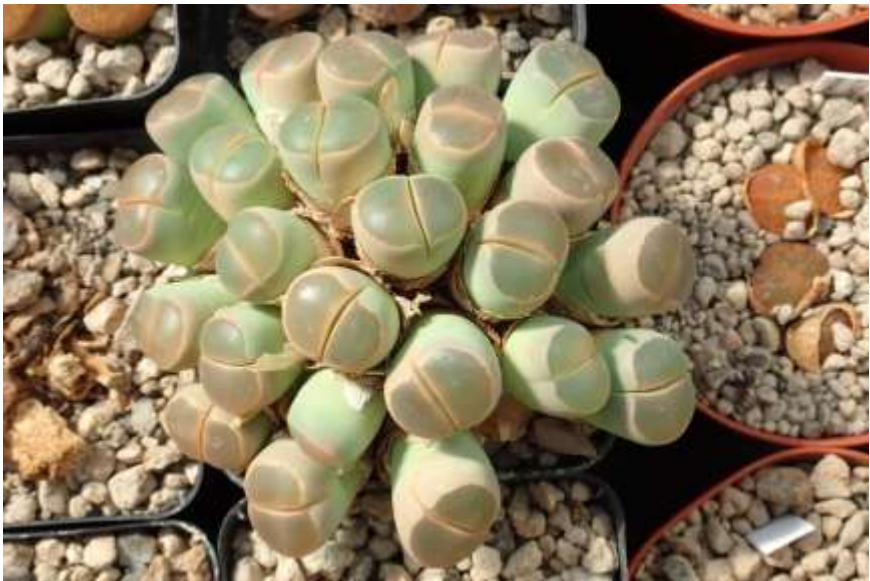
Close-up van het groepje middenvoor op de vorige foto.