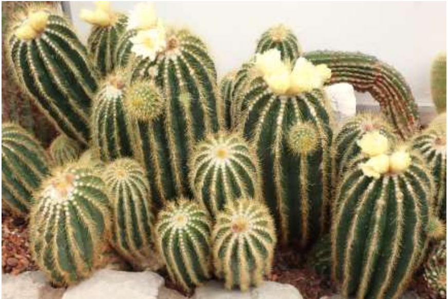
Een groep Parodia (Notocactus) magnificus .