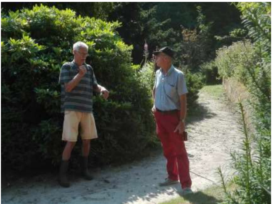
Partner van praat met de verzorger.