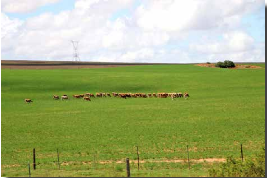
Koelen in de rij