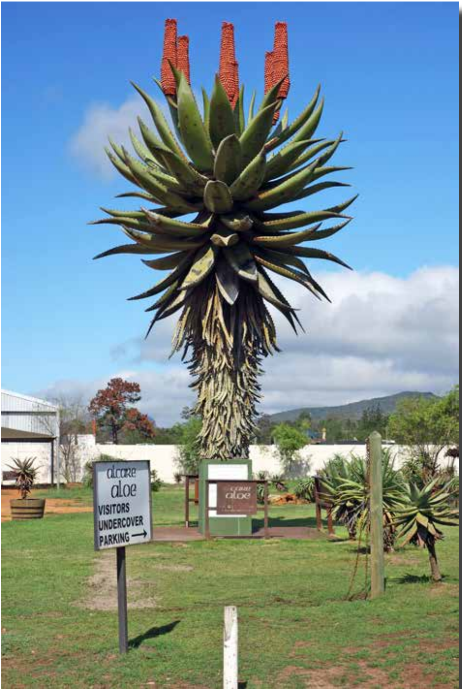
Aloe ferox standbeeld