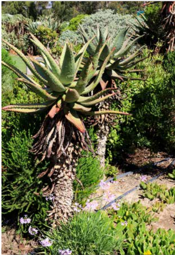
Aloe ferox met Tulbaghia