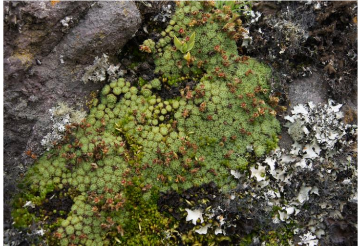
Saxifraga magellanica ssp. peruviana

dal een dikke mist opzetten, en nu rijden we terug richting Macusani, vlak voor het stadje komen we boven de wolken en schijnt het zonnetje weer, we rijden links een zijweggetje op en komen weer op de grote hoogvlakte, hier zien we weer talrijke groepen P. lagopus en A. floccosa met zelfs een cristaat, rond 5 uur rijden we terug naar Macusani, we kijken wat in het stadje rond en drinken een biertje, daarna relaxen we en poosje in het hotel, als we om half 7 wat gaan eten regent het en is het flink koud geworden. Terug in ons hotel kruipen we gelijk onder de dikke dekens om warm te blijven, we drinken nog een glaasje antivries en gaan dan al vroeg slapen. Vandaag 170 km.