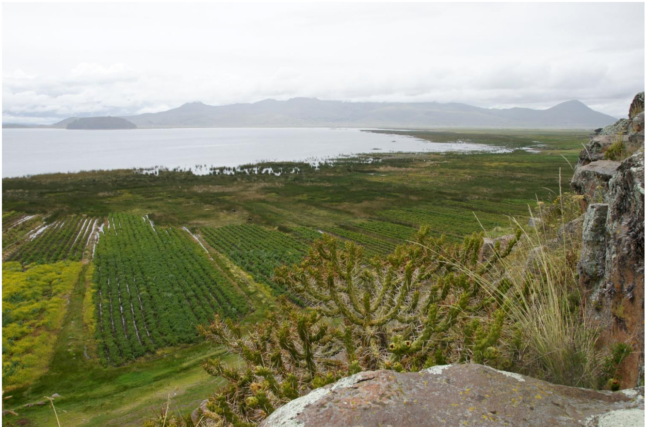
Titicacameer en Austrocylindropuntia subulata

Het heeft vannacht flink gewaaid en geregend, als we om 8 uur vertrekken is het bijna droog en 7 graden, we hebben inmiddels een dag ingehaald en kunnen vandaag een uitstap naar Desaguadero maken, we rijden nu zuidoost de ruta 3S op en volgen de oevers van het Titicacameer,