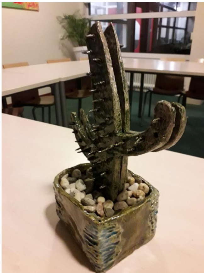
De zelfgemaakte 'cactus' van Lieda

En dan heeft ze een heel bijzonder cactus meegenomen. Zelf gemaakt, inclusief stekels en pot. Een waar kunstwerk.