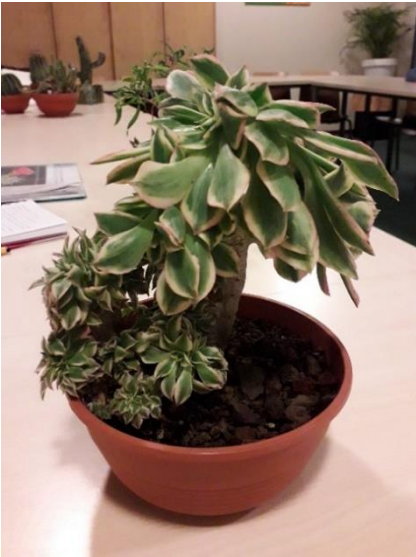
Aeonium 'Sunburst' van Ton