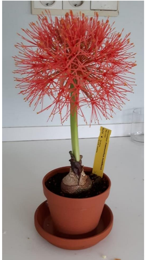
De haemamthus van Jac en Nia in knop en in volle glorie

gegadigden en die wordt verloot. Lieda is de gelukkige. Het kan een beetje als een cadeautje beschouwd worden, want ze wordt over 2 dagen 70 jaar en trakteert op appeltaart.