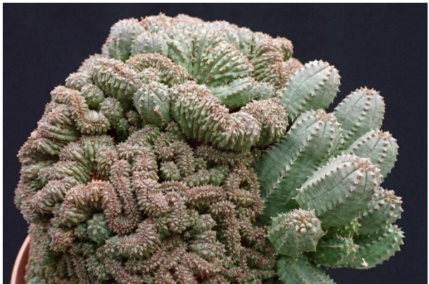
Euphorbiacristaat van Theo

En natuurlijk heeft onze Rotterdammer weer een grapje meegenomen. Er is iets met de plant aan de hand en wij mogen bekijken wat dat is. Hij gaat van hand tot hand, maar hoe we ook kijken, we zien niets vreemds. Degene, die er die avond niet waren, moeten maar eens even goed naar de foto kijken en niet verder lezen.