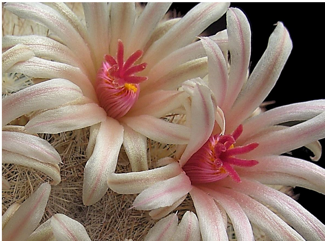
Een letterlijk fleurig plaatje in deze donkere tijden: Mammillaria candida in bloei