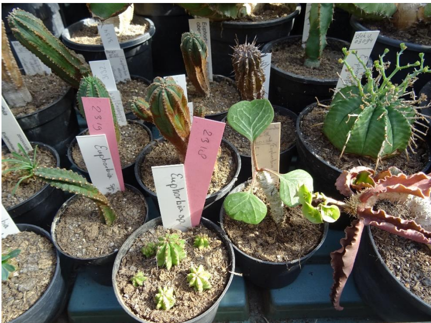
Een hoekje in de Euphorbiakas.