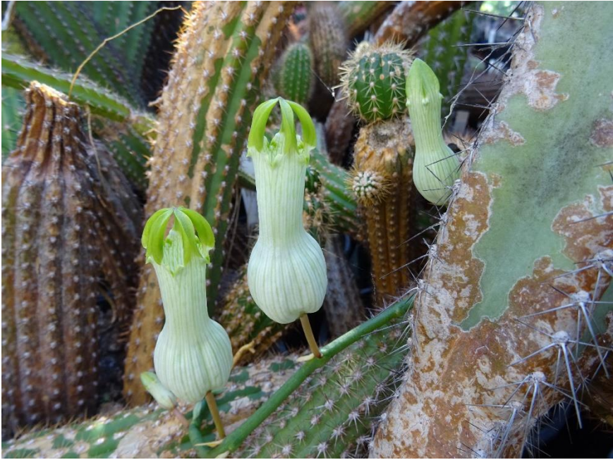
De bloei van Ceropogia ampliata .