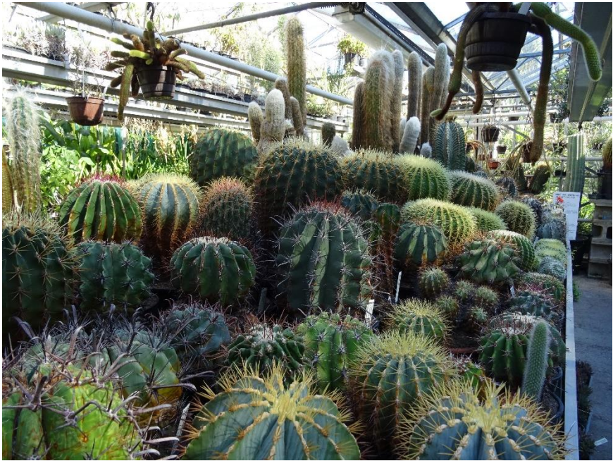
Al behoorlijk oude cactussen.