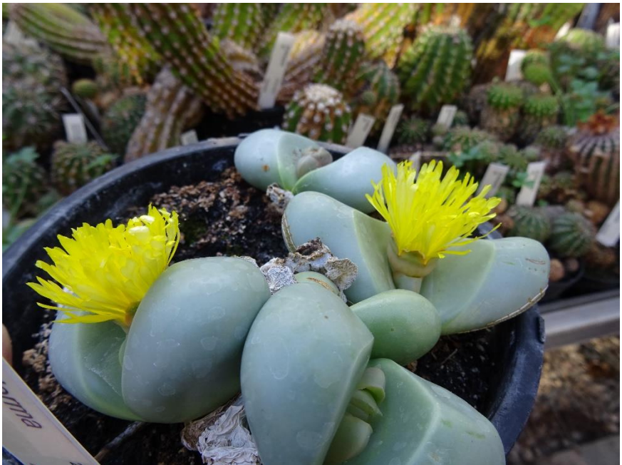
Argyrodema delaetii .