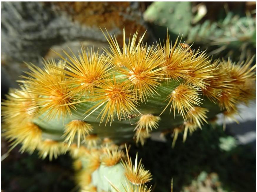
Een opuntia met mooi vallend licht.