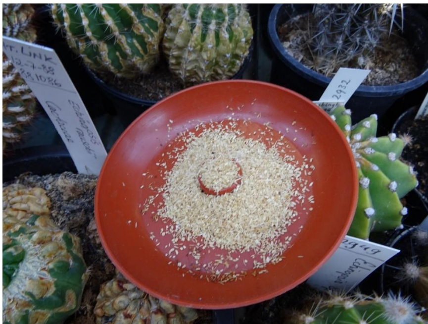
Schaaltje met materiaal voor de biologische bestrijding van plaagdieren.