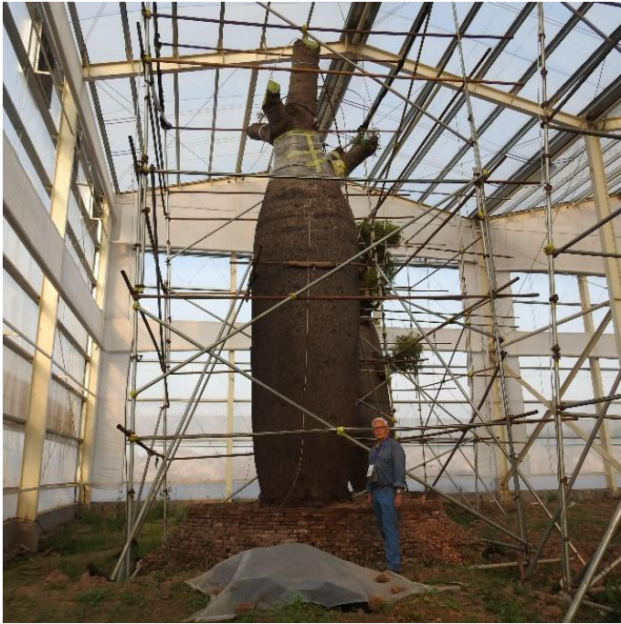
Henk Viscaal bij een geïmporteerde brachychiton, de Australische flessenboom.