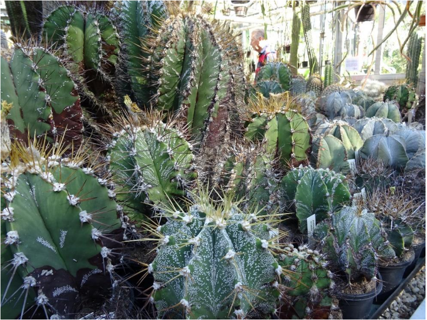
Mooie grote astrophytums.