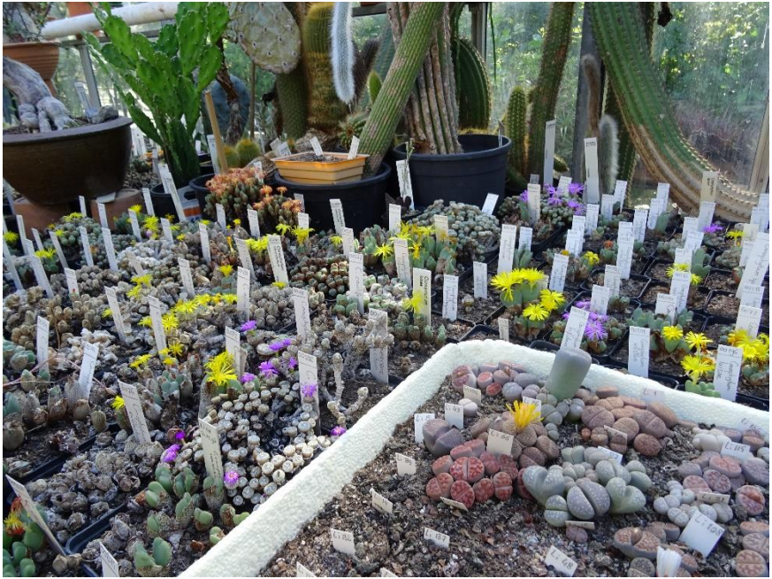
Een mooi hoekje.