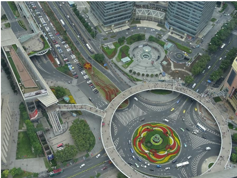
Uitzicht door de glazen vloer van de Oriental Pearl Tower.