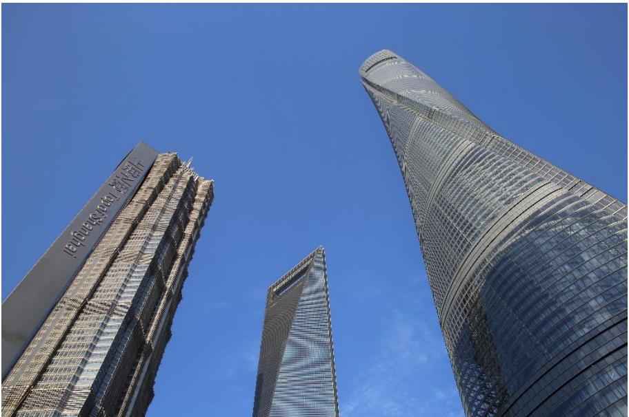
Modern Shanghai met rechts de Shanghai Tower, de op een na hoogste toren ter wereld, 628 m.