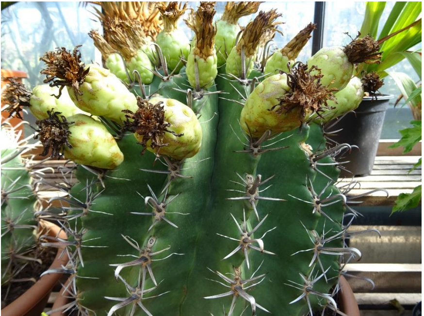
Vol met zaadbessen.