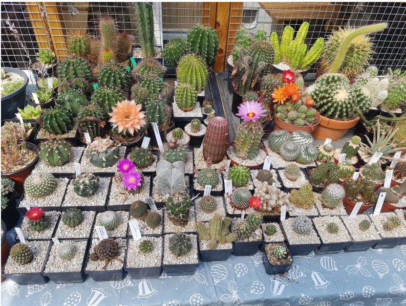
De planten onder een afdak in afwachting van een definitief verblijf!

Zo dit is mijn verhaal over het verzamelen van cactussen, hopelijk kan ik nog vele jaren genieten van de planten en bezoeken van liefhebbers.