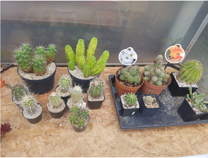
De oogst van een gesprek met een oude vriend

een houten kas na 15 jaar, de dakspanten waren versleten, dus er moest iets gebeuren. Nu deed zich ook nog de situatie voor, dat ik afgekeurd werd als brandweerman. Ik ging 500 gulden in loon achteruit, en met een