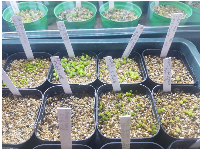
Natuurlijk werd er ook weer gezaaid!

Ben daarna naar een oude cactusvriend gegaan, om weer eens te praten over cactussen. Ging niet met lege handen naar huis, dus gelijk mijn slakasje uit de tuin gepakt om ze in te zetten.