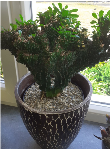
Een cristaat Euphorbia bij Ubink

gebrek aan artikelen is voor het afdelingsnieuws. Kijk het komt wel vol maar enige variatie in schrijvers zou mooi zijn. Inmiddels heb ik een aantal leden gevraagd om iets te schrijven, soms zelfs een idee er bij vermeld. Gelukkig reageert iedereen positief hetgeen kan zorgen voor leuke nieuwe artikelen.