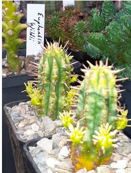
Stekken van de onder afgebeelde Euphorbia

Gelukt, twee Euphorbia's (cristaat) en een