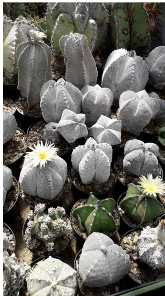
Verzameling Astrophytum s o.a. A. ornatum en myriostigma

en Mexico. Van deze soorten zijn ook veel onderlinge kruisingen bekend. De bloemen kleuren van roze-rood naar wit maar ook van wit tot bijna geel. Ze maken dikke penwortels. En de verzorging is vrij eenvoudig. Alleen moet je