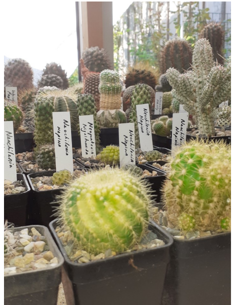
Notocactus met afwijkingen in het bladgroen

Onze oud-voorzitter gaf tijdens de buitenbijeenkomst aan dat er een