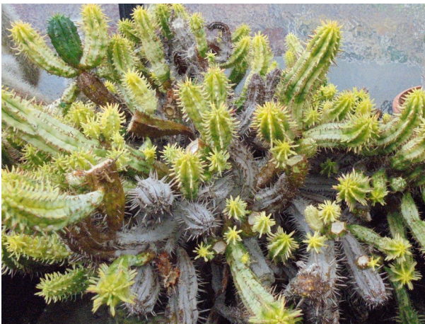
Nogal bonte Euphorbia!