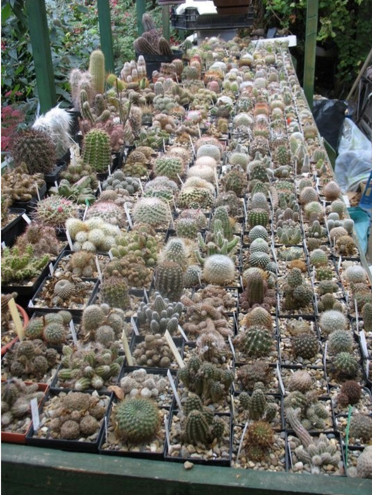
Een opname van mijn oude verzameling

Ik zal een jaar of 15 zijn geweest, toen ik voor de eerste keer met cactussen in aanraking kwam.