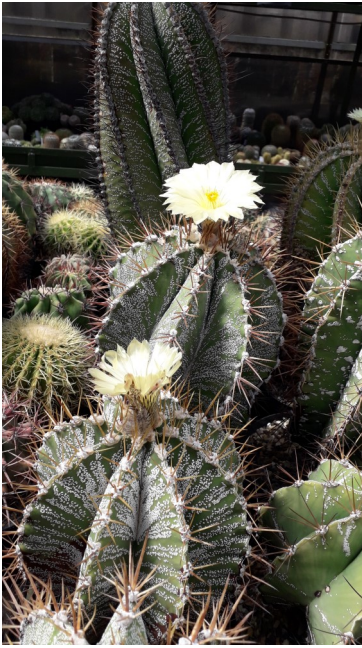
Nog enkele fraaie Astrophytums

er rekening mee houden dat de bloeiperiode ligt tussen september en november. Het zijn geen moeilijke planten. Dus de tijd van water geven ligt anders.