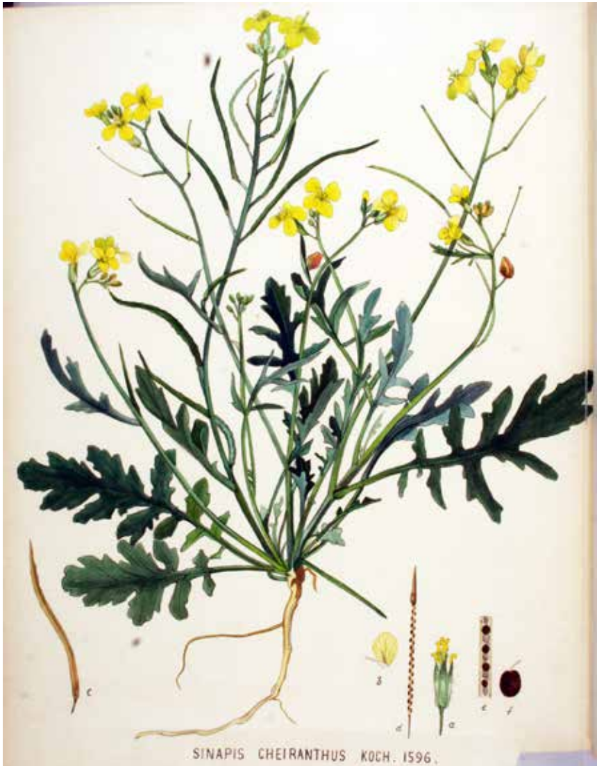
SINAPIS CHEIRANTHUS KOCH. 1596.

Onder de inzenders van de goede oplossing van de puzzel wordt een plantje verloot.