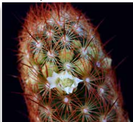
Mammillaria elongata fa