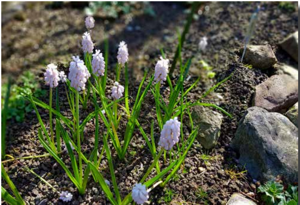
Muscari 'Pink Sunrise'