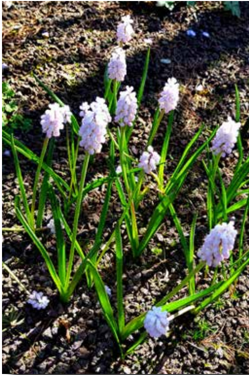
Muscari 'Pink Sunrise'