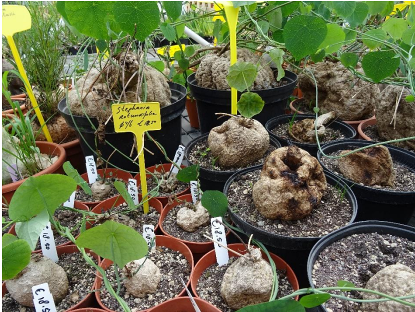
Caudexplanten in de verkoop.