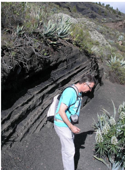
Echium decaisnei in de Caldera de Bandama, Gran Canaria.

en Corfu, een verdroogd 'houtje' uit Kew Gardens die uitgroeide tot een Pelargonium gibbosum , een succulente zuring van La Palma, een succulente paardenbloem van Madeira.