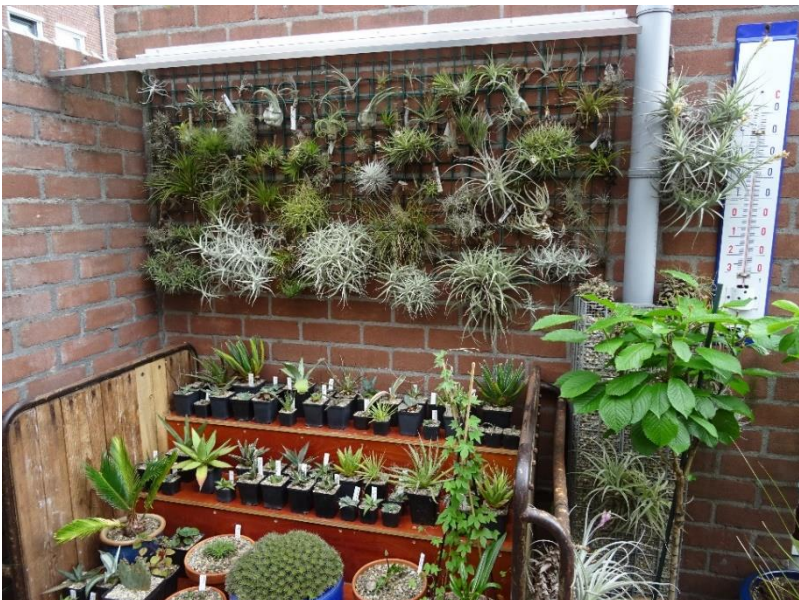
Tillandsia's onder een afdakje.