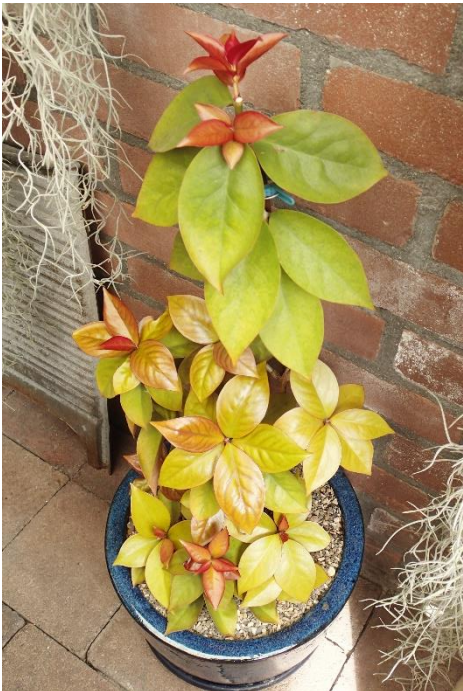
Ook een cactus, Pereskia aculeata var. godseffiana .