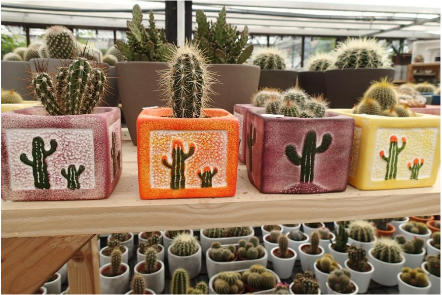
Cactusbakjes met cactussen.