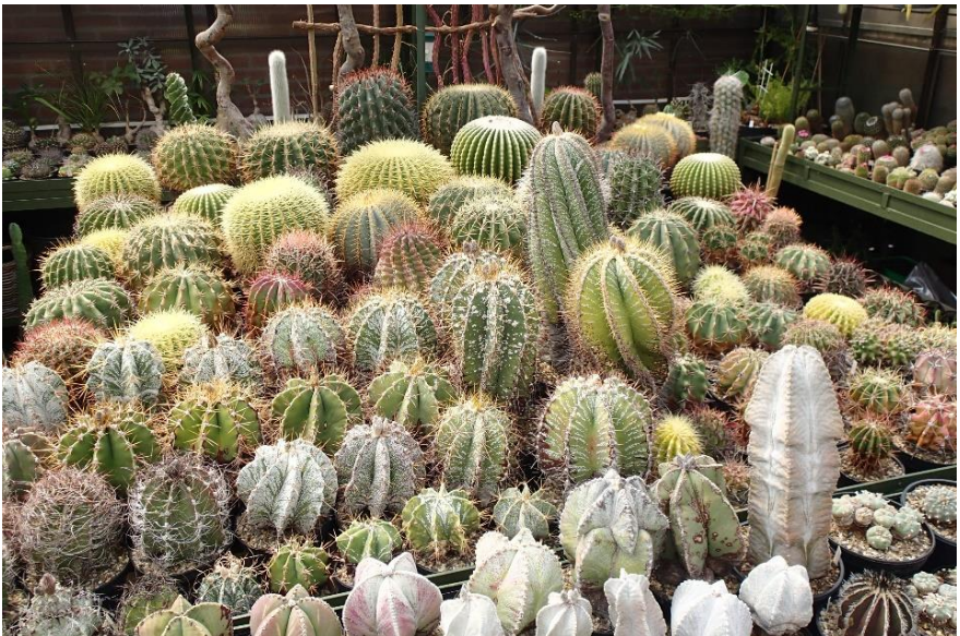
Astrophytums en echinocactussen in het middentablet.