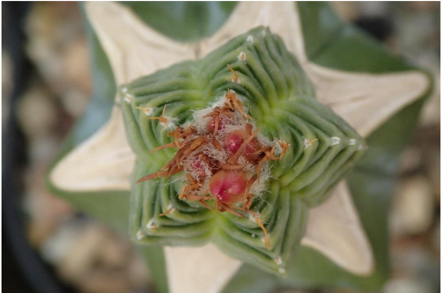
Aztekium valdezii, ongeveer 2 cm in diameter.