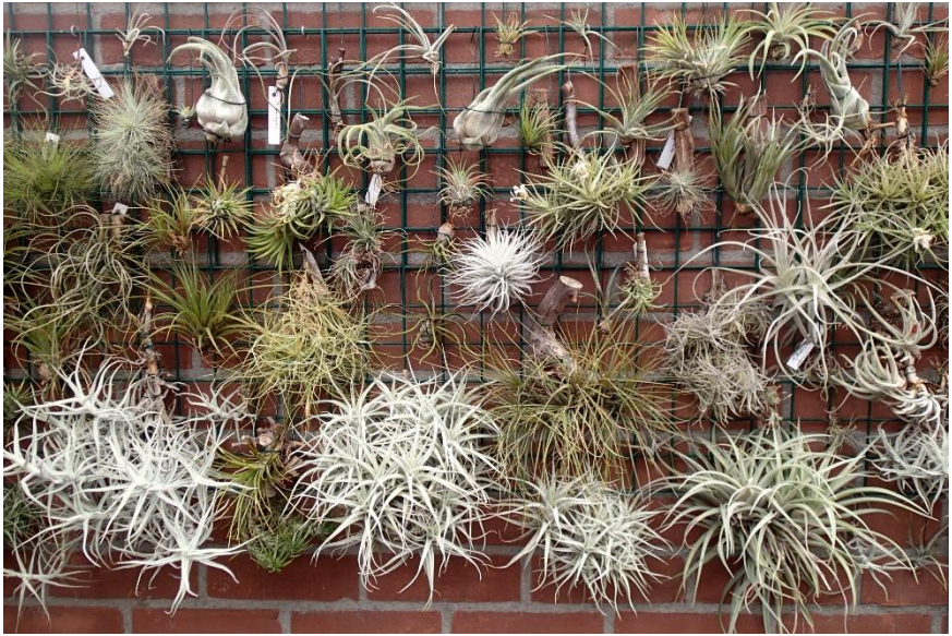
Nogmaals de tillandsia's.