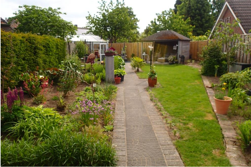
De tuin met kas en overdekt zitje in de tuin bij Jac Huys, de eerstbezochte.