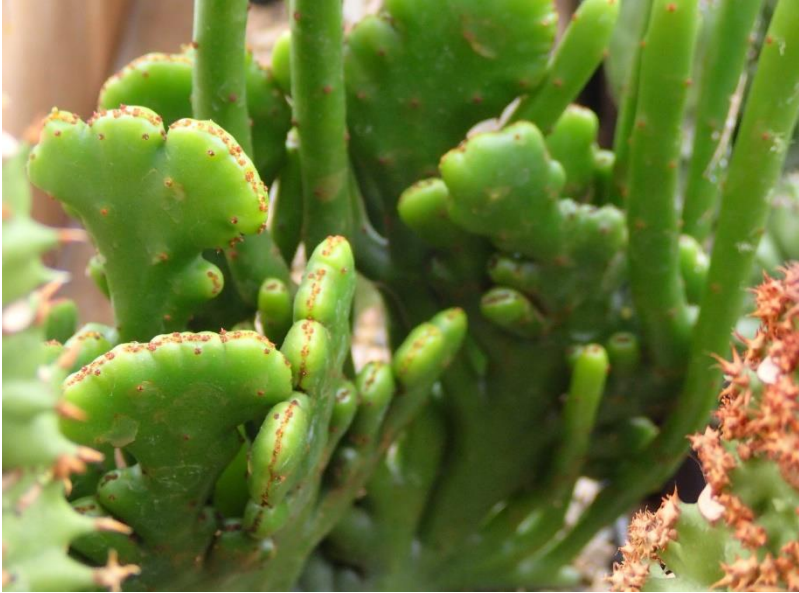
Een cristaat van Euphorbia alluaudia .