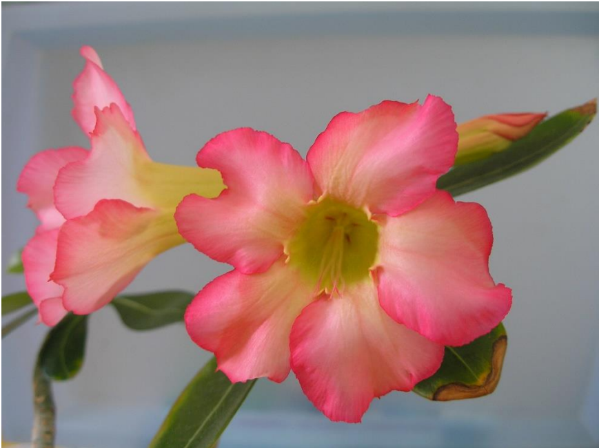
Adenium obesum, gezaaid in het jaar dat ik lid werd van Succulenta.