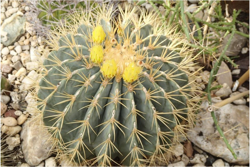
Ferocactus glaucescens in bloei.