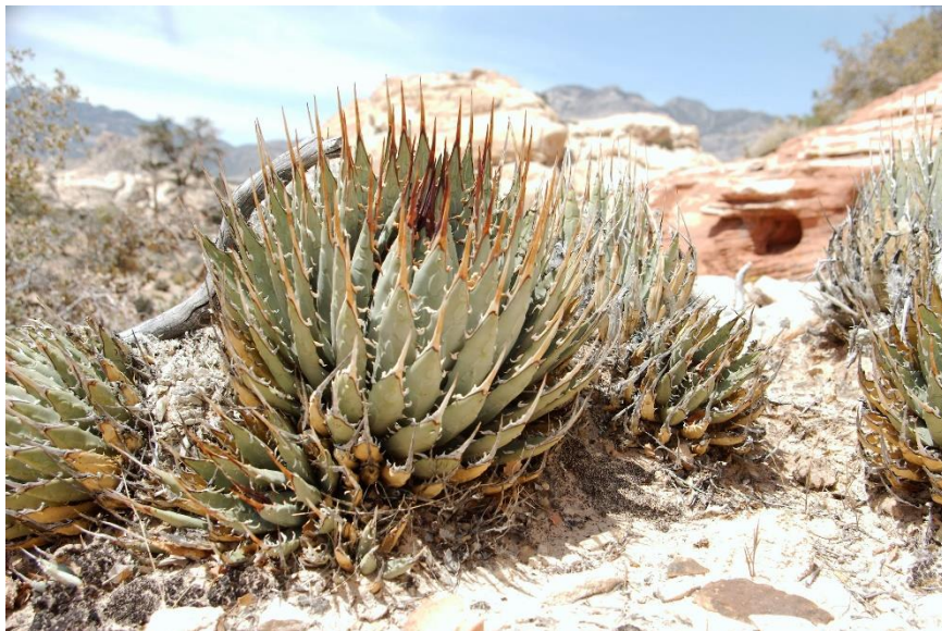
Agave utahensis var. eborispina .

Een prachtig stuwmeertje Barkerdam midden in de woestijn. Mooie yucca's, levensgevaarlijke teddybeercholla's, massale Echinocereus engelmannii .