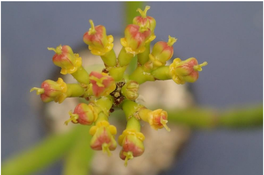
Vruchtvorming bij een Euphorbia alluaudia.