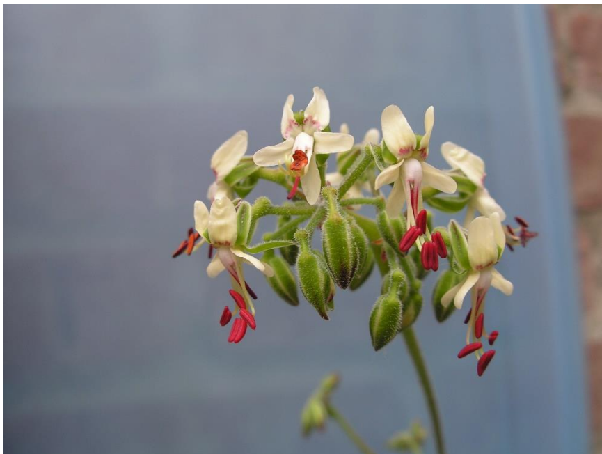
Pelargonium laxum, bij Van Donkelaar gekocht als P. carnosum , een vaak gemaakte naamsverwisseling.

Een andere neiging die ik gelukkig te boven ben gekomen, is bomen zaaien. Vooral na het eerste bezoek aan Madeira liep dat erg uit de hand. Op een gegeven moment had ik vier soorten palmen, vijf soorten Brachychiton, Tipuana tipu ,Chorisia,