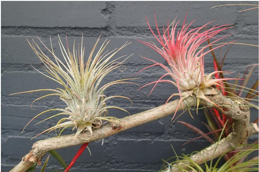
Nog meer tillandsia's.