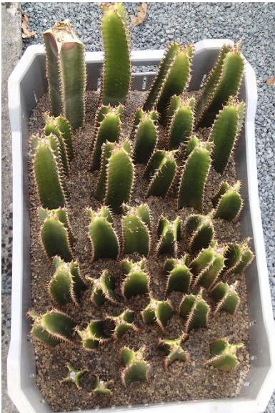
Een bak met stekken van Euphorbia canariensis buiten bij de ingang van de kas.