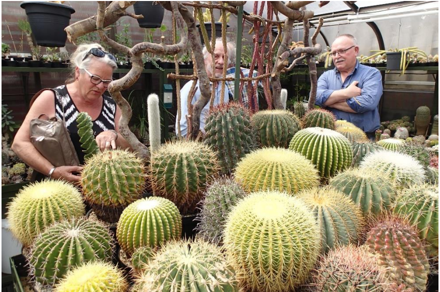
Bij de bolcactussen.