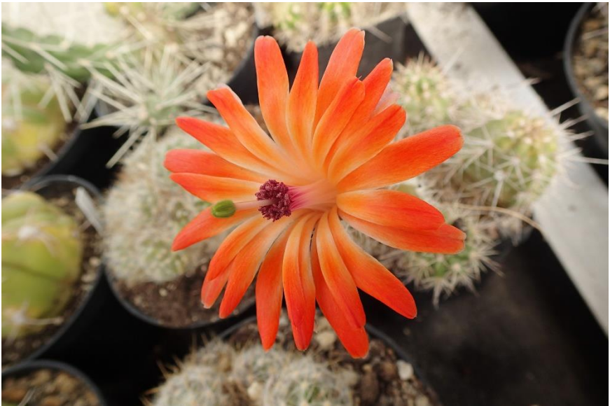
Een mooie echinocereus.