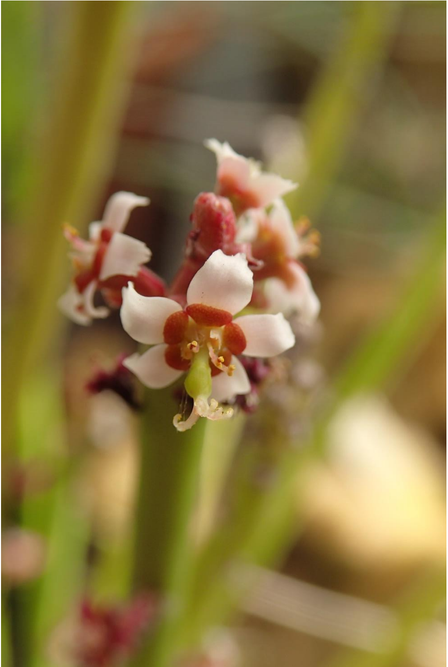
Euphorbia antisiphilitica in bloei, nog steeds bij Jac Huys.