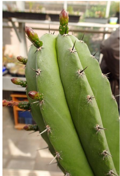
Een zuilcactus in de knop in de middenbak.