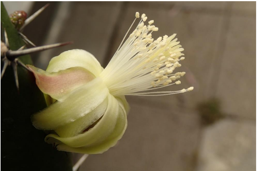
De zuilcactus die bij Jac in de knop zit, staat hier al te bloeien.