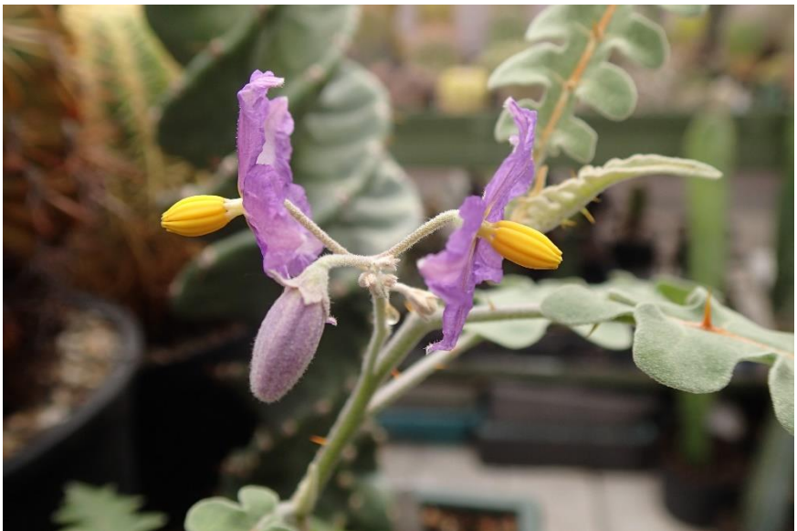
Er is ook nog plaats voor een 'tomaat' met bestekelde bladeren.