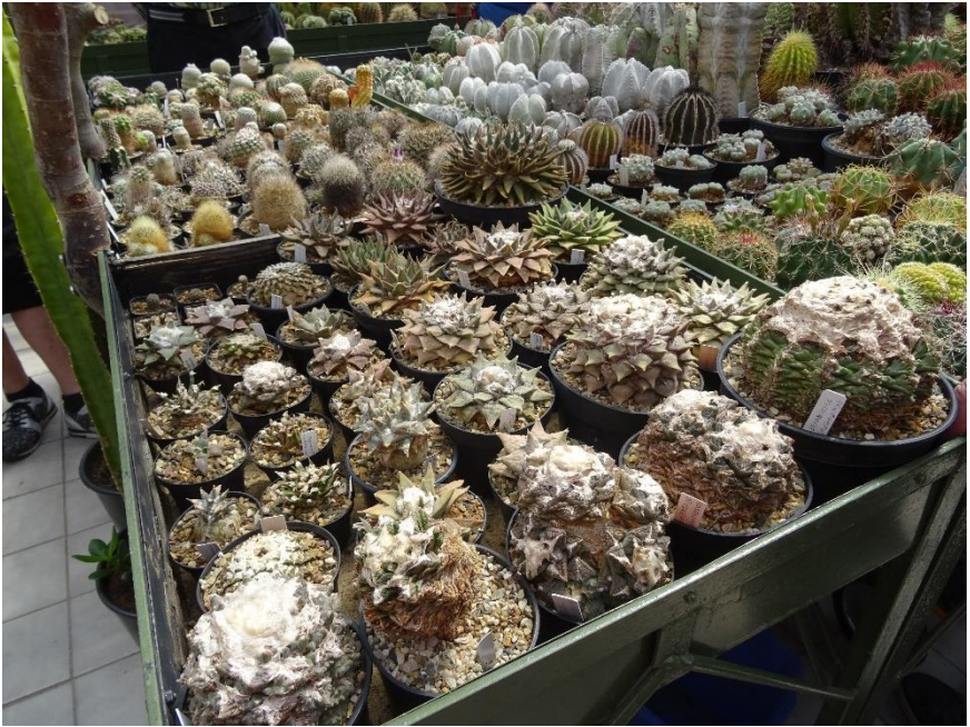
Een fraaie collectie ariocarpussen.