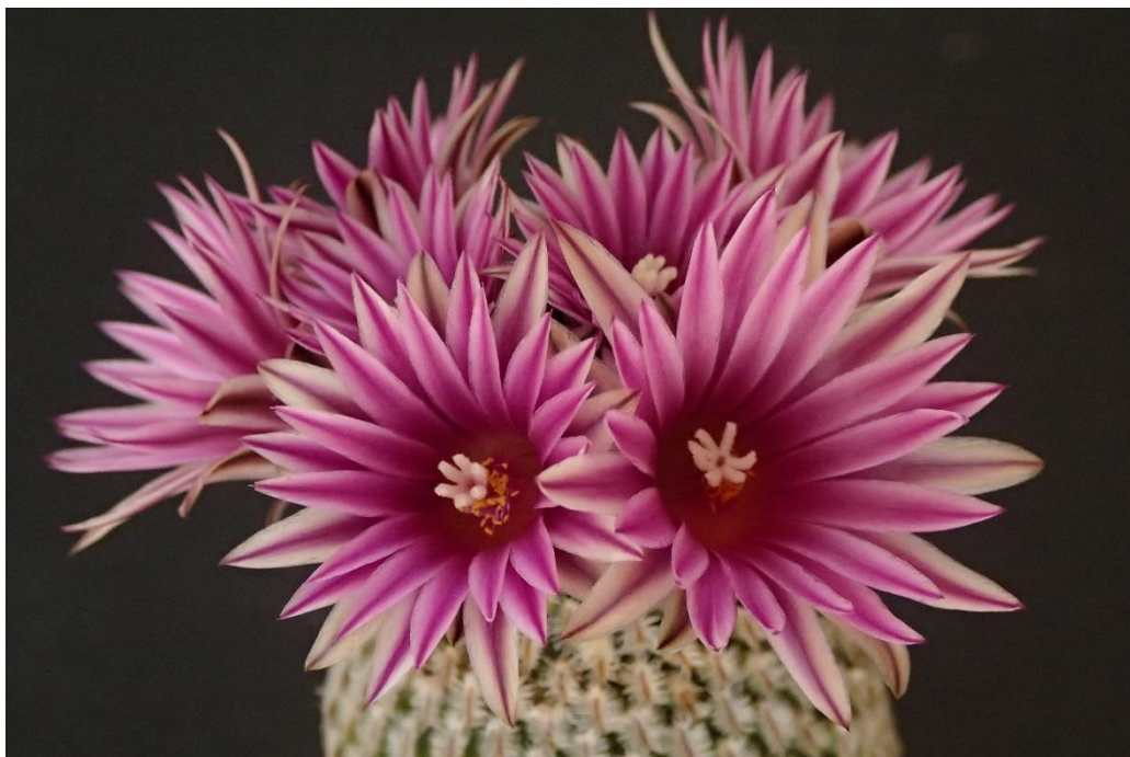
Acht bloemen op 21 maart in mijn Turbinicarpus pseudopectinatus