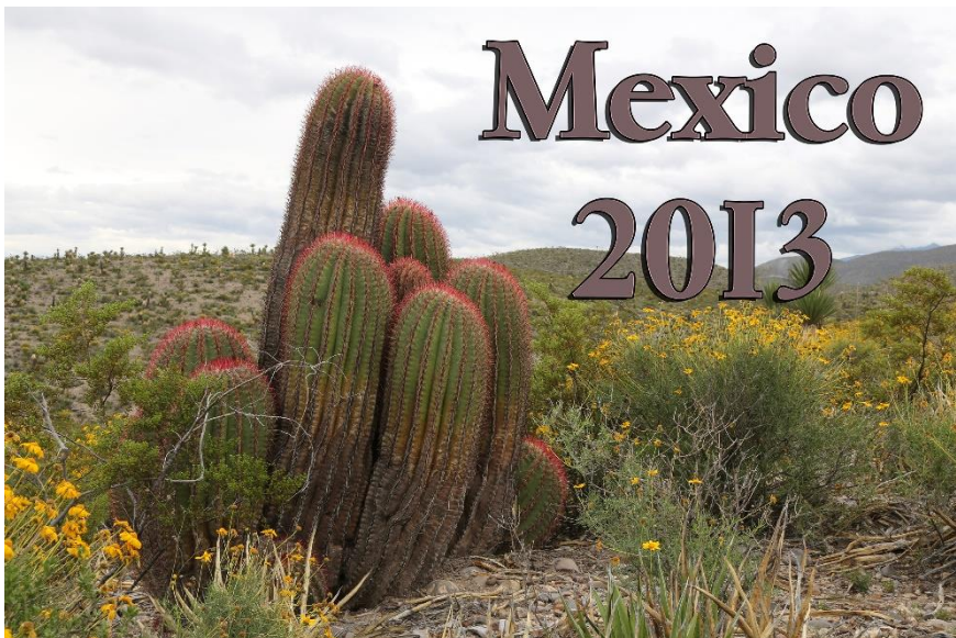
Ferocactus pilosus

Het ging om een reis gemaakt in 2013 naar midden Mexico. De tocht was een grote cirkel min of meer ten noorden van Mexico City. Eerste stop Santa Rosa dan verder richting westkust (Santa Cruz), verder naar het noorden, dan weer oostelijk afzakken naar