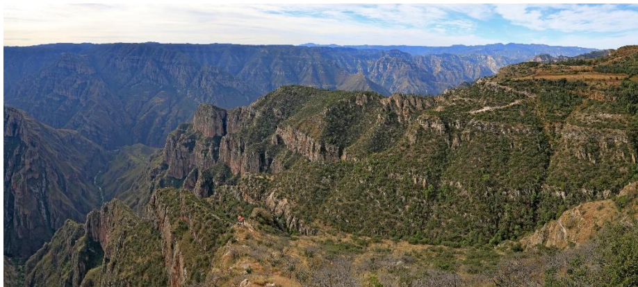
Sinfrosa Canyon

Hierna afgezakt naar de Barranca de Sinforosa (zie Succulenta 98-2, een speciaal plekje 14) met een groep Ferocactus , dasyliirions , een yucca rostrata (bloeit wit).