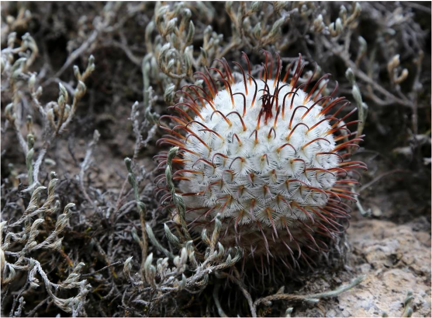
Mammillaria perezdelarosae

Opnieuw een dreigende onweerslucht. Altijd leuk: een kleurrijke markt bezoeken.