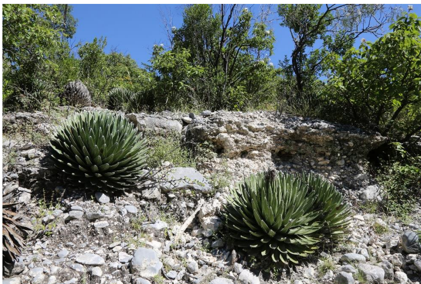
Agave victoria-reginae

In de omgeving van El Ocote een van de allermooiste mammillaria 's gevonden, nl de mammillaria perezdelarosae met een doorsnede van 4 cm.