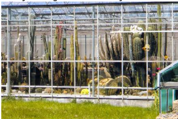
Kas van Aad Vijverberg

Bij Aad was het eerste dat opviel een grote puinhoop met prachtige planten en een schitterende vijver erachter. Na veel lovende woorden over zijn rotstuin, naar zijn kas die wij al op een afstandje hadden ingeschat als een flinke kwekerij. Tot mijn verbazing vertelde Aad dat dit zijn hobbykas is.