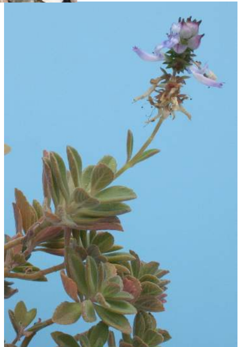
Foto hiernaast voor blz. 6 Plectranthus neochilus

De omgeving van het zaad en de zaailingen werd op een temperatuur gehouden van maximaal 25 °C.