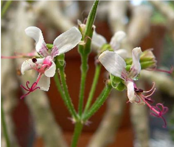
Pelargonium carnosum

Moeilijk met Pelargoniums is dat er winter- en zomergroeiers zijn. Voor water geven is in ieder geval de stelregel: alleen als de plant nieuwgroei vertoont. Wanneer de bladeren geel worden en afvallen dan is dat naar alle waarschijnlijkheid het sein dat hij in rust wil. Stop dan met water geven.