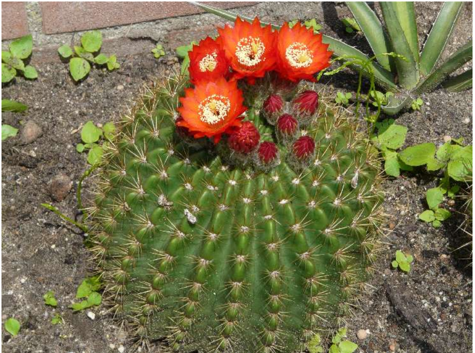
Lobivia bruchii in de tuin van Gerrit Roest

Het verhaal van mijn Lobivia bruchii planten.