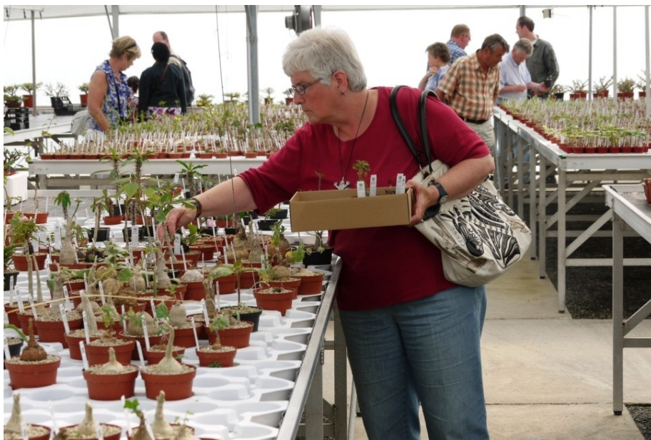
bij de "Specks" konden we onze verzameling echt spekken.....