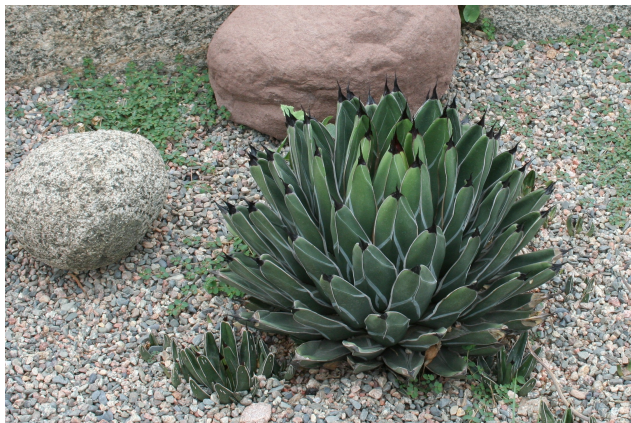
Agave ferdinandi – regis

In september dient een Agave te worden meegebracht