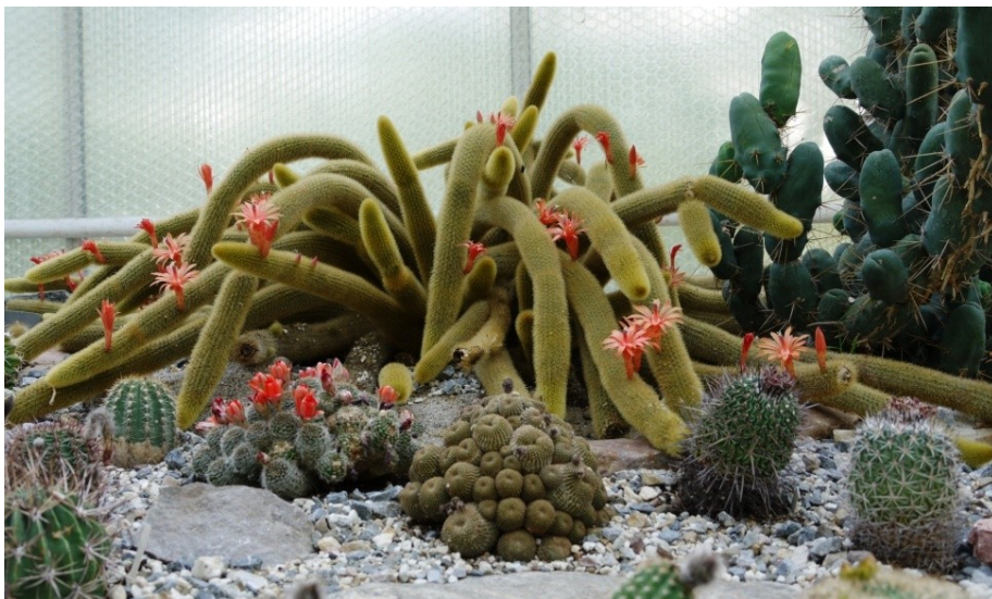
'n groep cactussen in de Jochumhof in Steyl.

De volgende fraaie foto's, gemaakt door Margareth Timmermans , zijn ter illustratie: