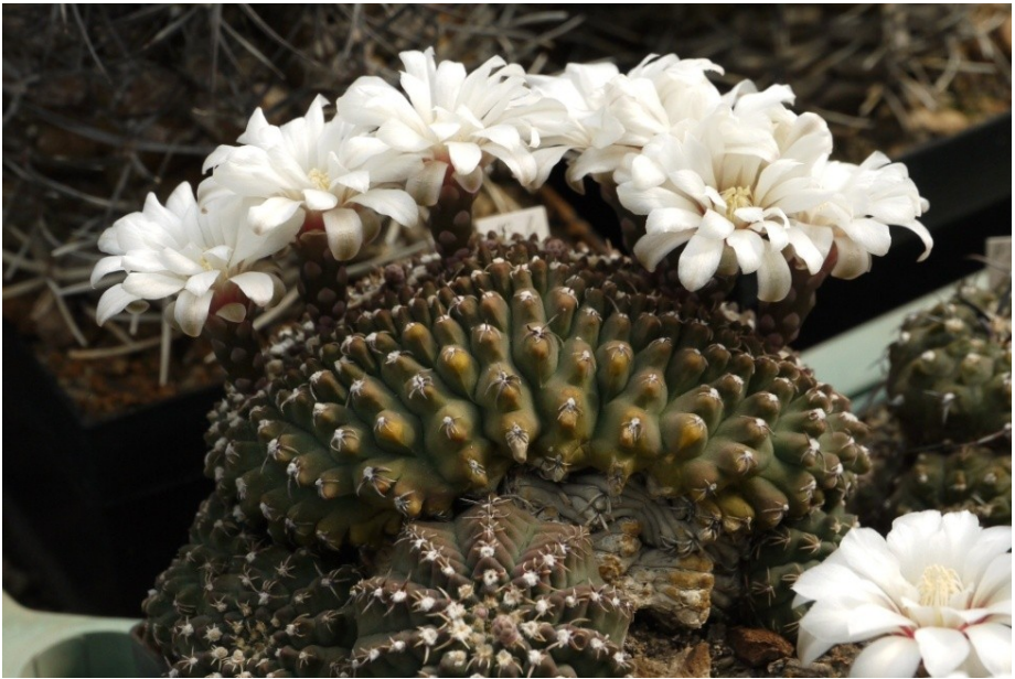
bij Brigitte en Jörg Piltz: een cristaat in bloei [Gymnocalycium quehlianum aff.]