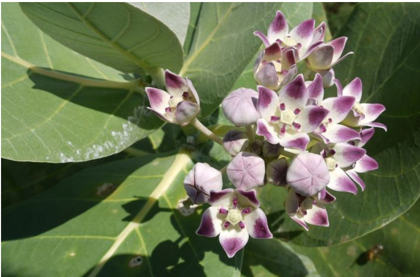
Calotropis procera [ook wel "Apple of Sodom" genoemd]