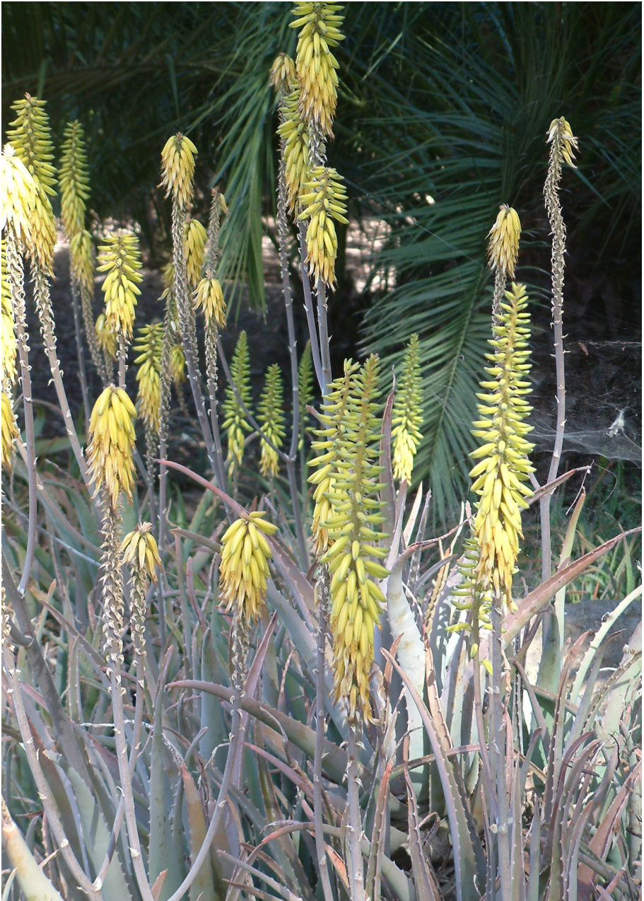
Aloe vera (Gran Canaria, 2004 – foto HD )