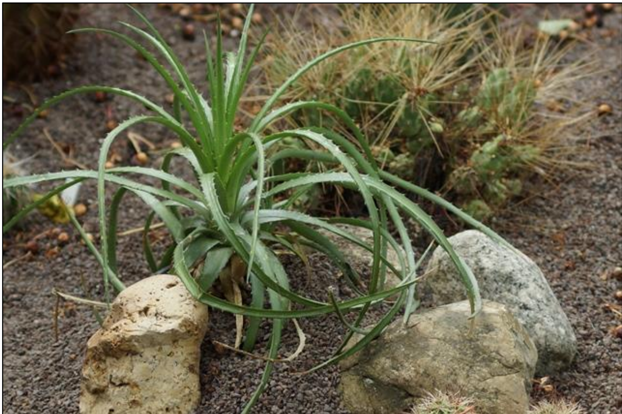
De plant van de maand Hechtia lanata

De Hechtia groeit in zanderige, rotsachtig terrein en deze zou moeten worden nagebootst als ze worden geplant. Gebruik een zanderige grondmengsel die goed doorlatend is. Het toevoegen van grof zand, perliet of kleine stenen aan de reguliere potgrond moet zorgen voor een goede afwatering van deze planten.