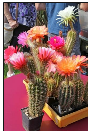
Bij Nicolas Samyn

Aangezien we hier nog niet geweest waren, was het een verrassing wat we bij Rik Bruneel zouden aantreffen. Maar dat kwam helemaal goed, want in een grote tuin stonden een aantal kassen met in de ene kas vooral cactussen en in de andere vooral vetplanten. En dan was er nog een overkapping met een verzameling agaven. Er was dus voldoende te zien hier, maar wel met een beperkt aantal plantjes wat te koop was. Maar goed, daar hadden de meesten toch geen tijd voor want hier zouden we de lunch gebruiken. Zoals we ondertussen gewend zijn waren er weer lunchpakketjes met een kop soep en