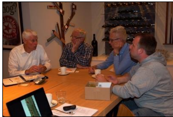
Het uitdelen van de zaden voor de zaiwedstrijd