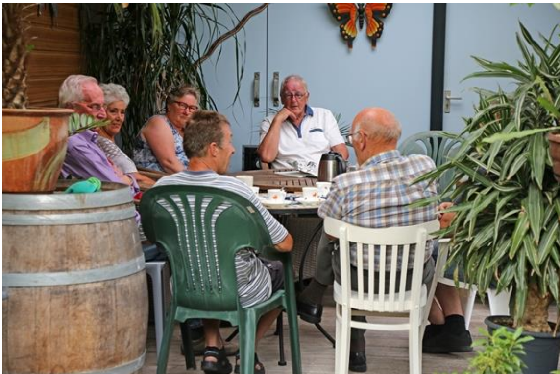
Onder de carport