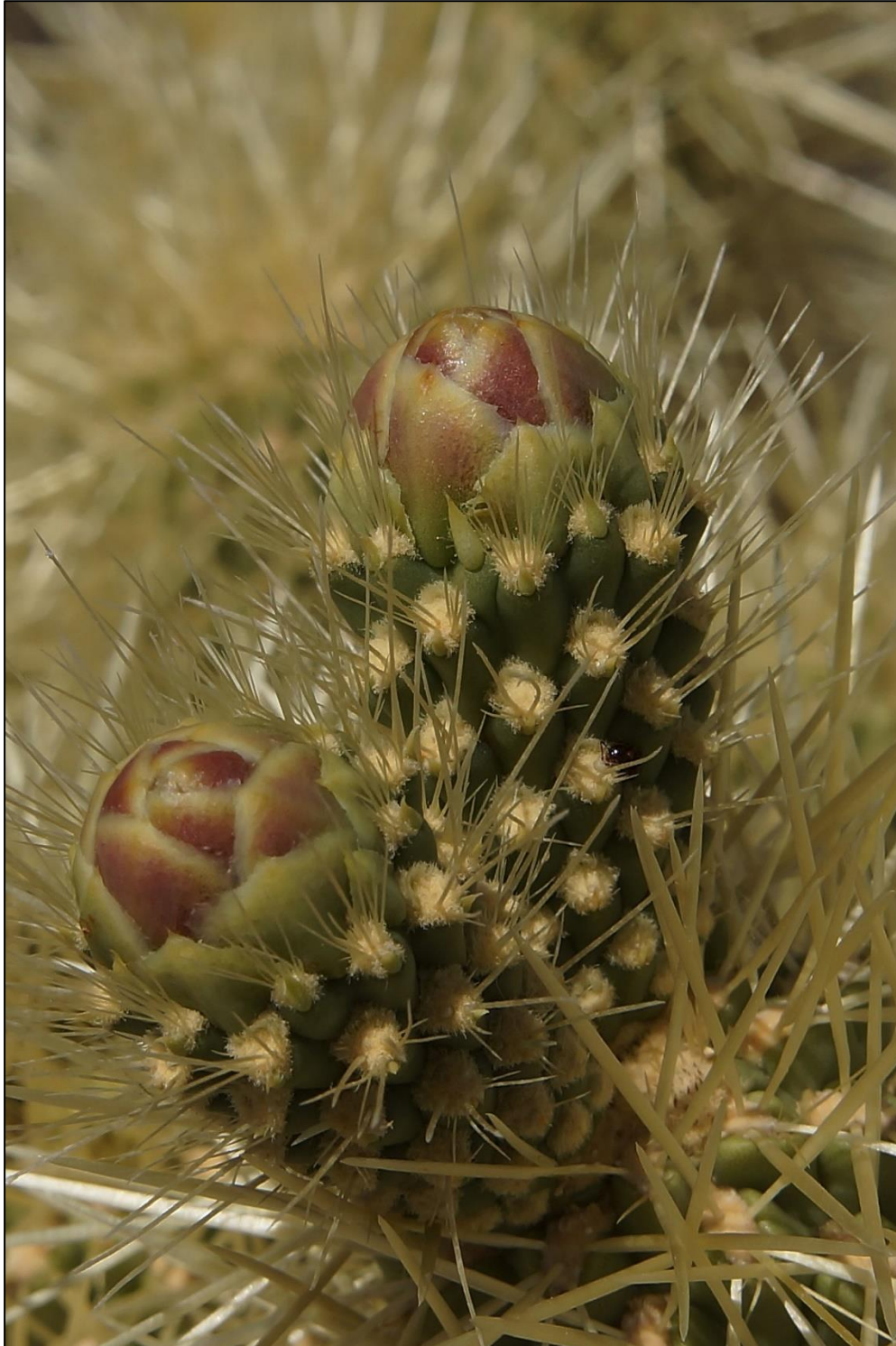
Bloemknoppen van de Cylindropuntia bigelovii , Organ Pipe Cactus National Park USA

Verenigingsblad van de afdeling Gorinchem - 's-Hertogenbosch van Succulenta