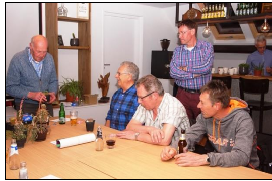
De verloting maandag 9 april