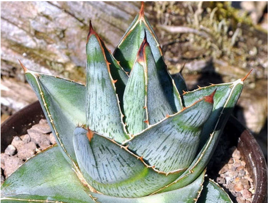
Agave pumila – jeugd stadium