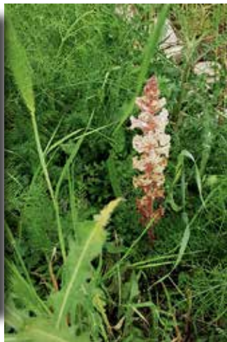
De juiste foto Bremraap