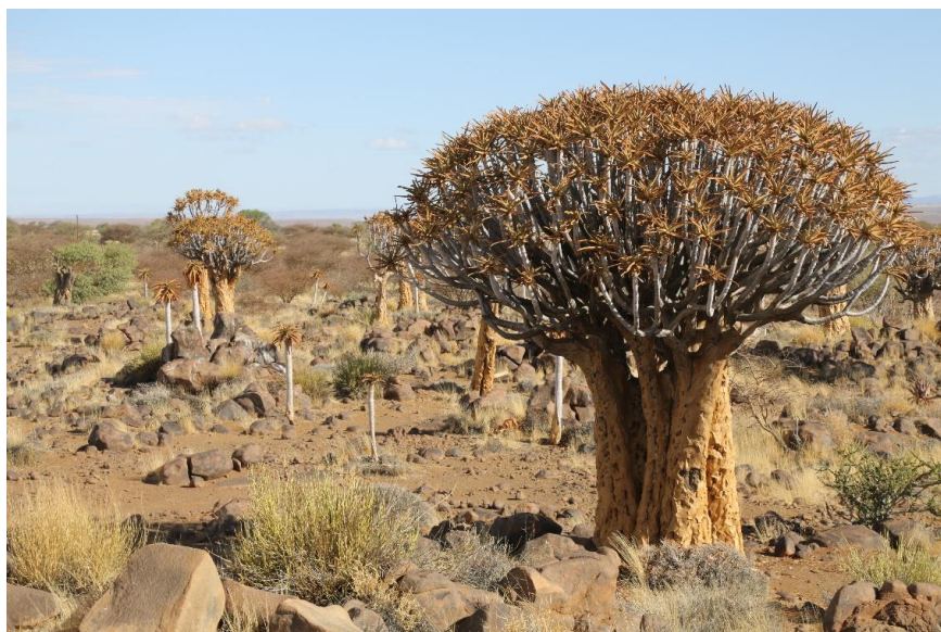
Aloe dichotoma in Namibië

Het programma voor dinsdag 2 oktober staat nog niet vast.