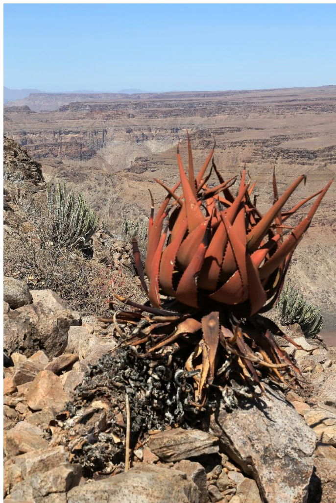
Aloe garipensis in Namibië