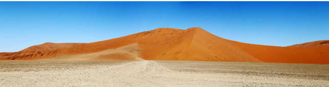
Zandduinen bij Sossusvlei in Namibië