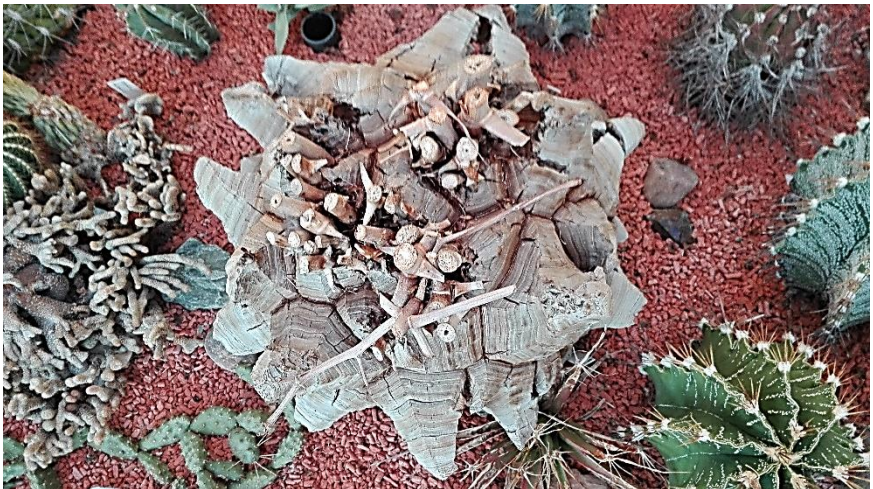
Olifantspoot, Dioscorea elephantipes