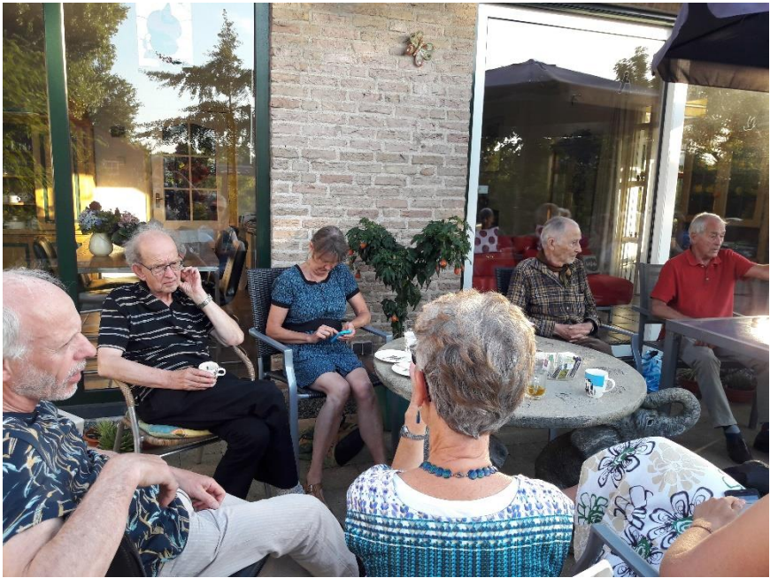
Gezelligheid rond de tafels