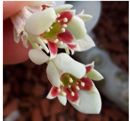
Mooi bloemetje toch van de Pachyphytum oviferum ?