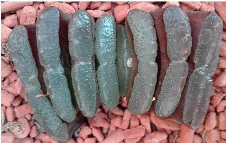
Nog een Haworthia truncata