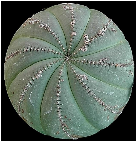
Close-up van de grootste bolvormige Euphorbia van bovenstaande foto, Euphorbia obesa subsp. symmetrica