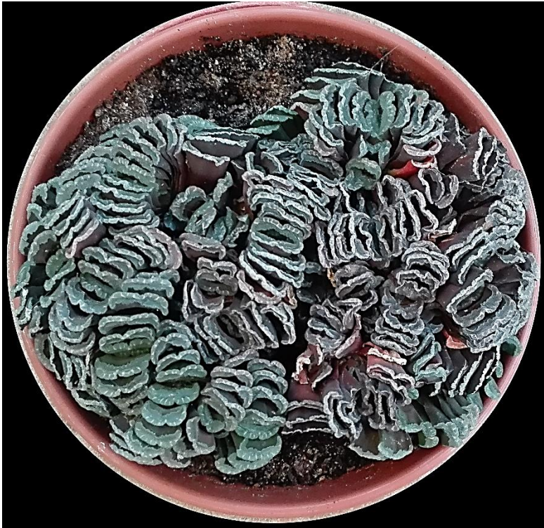
'Heen en weer', gaat deze schaalvullende Haworthia truncata