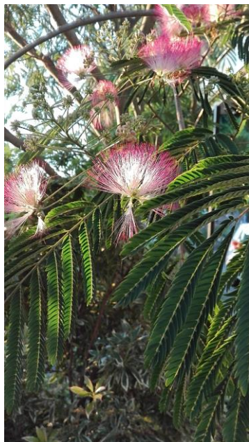
De Albiza (Perzisch slaapboom, beschenen door de avondzon.