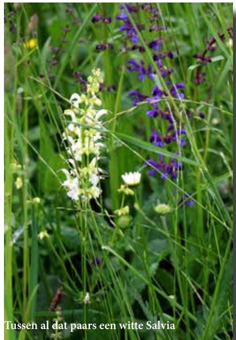
Tussen al dat paars een witte Salvia