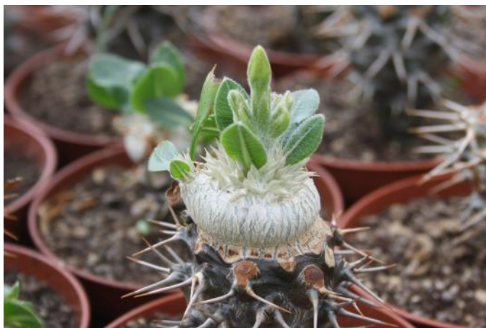
Een geënte Pachypodium brevicaule

Zelfs nu nog een dikke week later, je doet je ogen dicht, denkt aan deze verzameling en je ziet het weer zo voor je. Dit soort bezoekjes zijn echt de krenten in de pap.