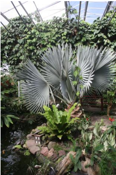
Zomaar een mooi hoekje

bied van succulenten doch wel benieuwd naar de tuin.