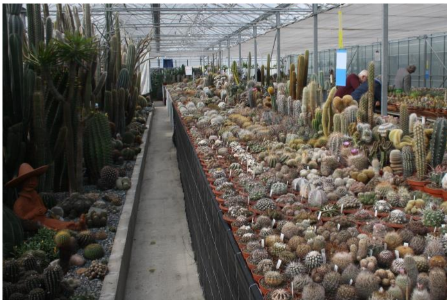
In de kas bij Aad Vijverberg

mooie grote gele bloemen gaan geven. Het advies hierbij was om de plant in de wintermaanden naar binnen te halen.