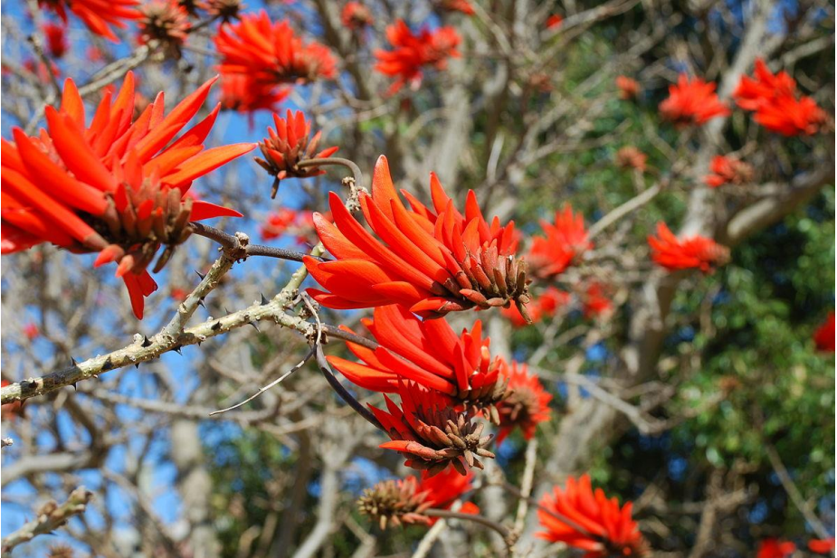
Een stukje koraalboom