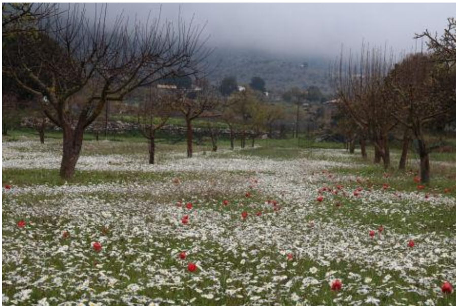
Katharo, Anemone coronaria