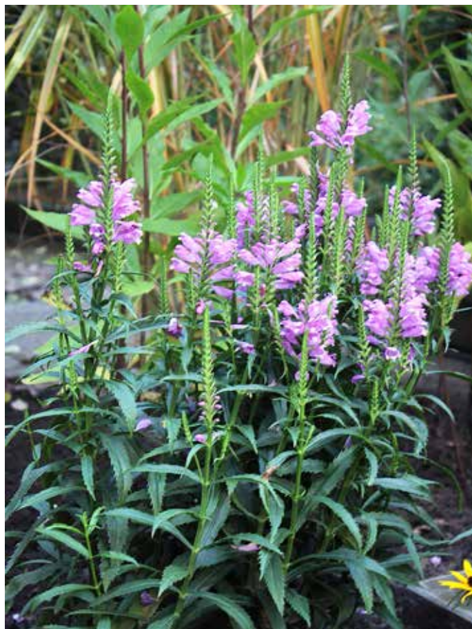
Physostegia virginiana 'Vivid'

In 1683 is de plant ingevoerd. De rechtopstaande plant heeft vierkan- te onvertakte stengels die een meter hoog kunnen worden. De blade- ren zijn lancetvormig en getand. Van juli tot september bloeit ze met roze of witte bloemen. De bloemen staan meestal in vier rijen in een dichte eindstandige schijnaar. Bij een schijnaar zijn de zijassen sterk verkort waardoor de bloeiwijze op een aar lijkt. Met een klein steel- tje zijn ze aan de aan de stengel verbonden. De bloemen kunnen ge- makkelijk opzij en weer terug in de beginstand bewogen worden. Vandaar de naam scharnierbloem. Physostegia heeft langzaam krui- pende wortelstokken en kan een flinke ruimte in beslag nemen. Ze verlangt een vochtige humusrijke bodem in de volle zon.