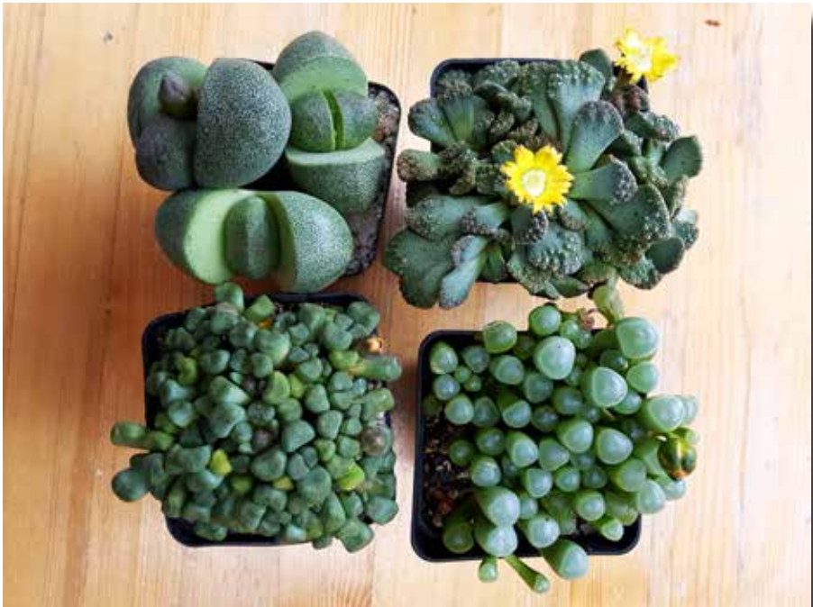
Een goed begin in het nieuwe jaar