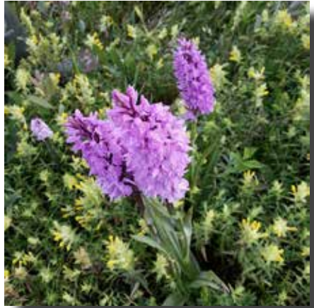
Gele ratelaar en gevlekte orchis