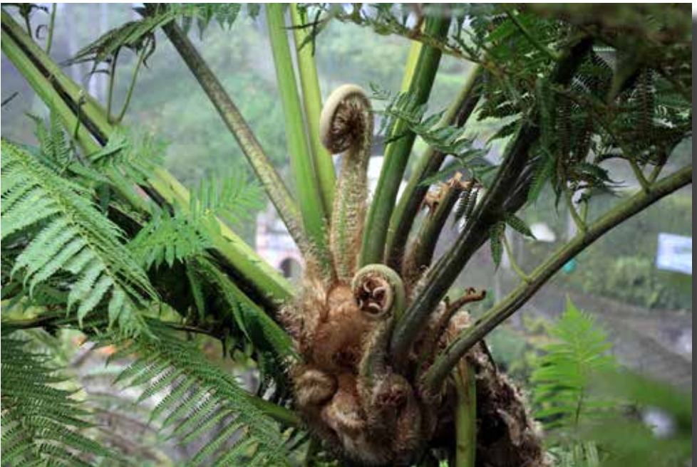
Cyathea cooperi Australische boomvaren