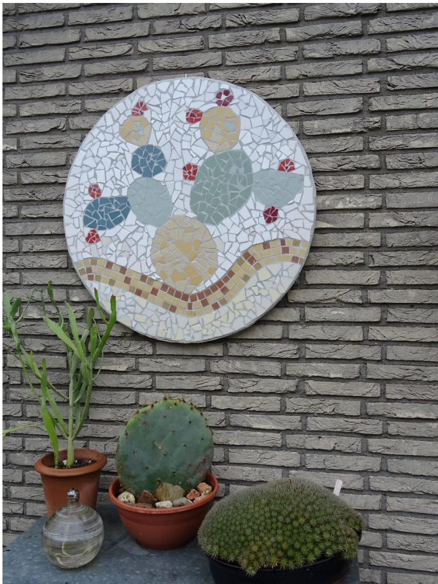
Cactusmozaïek aan de buitenmuur