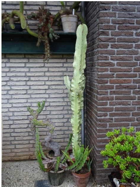
Nog een leuk hoekje