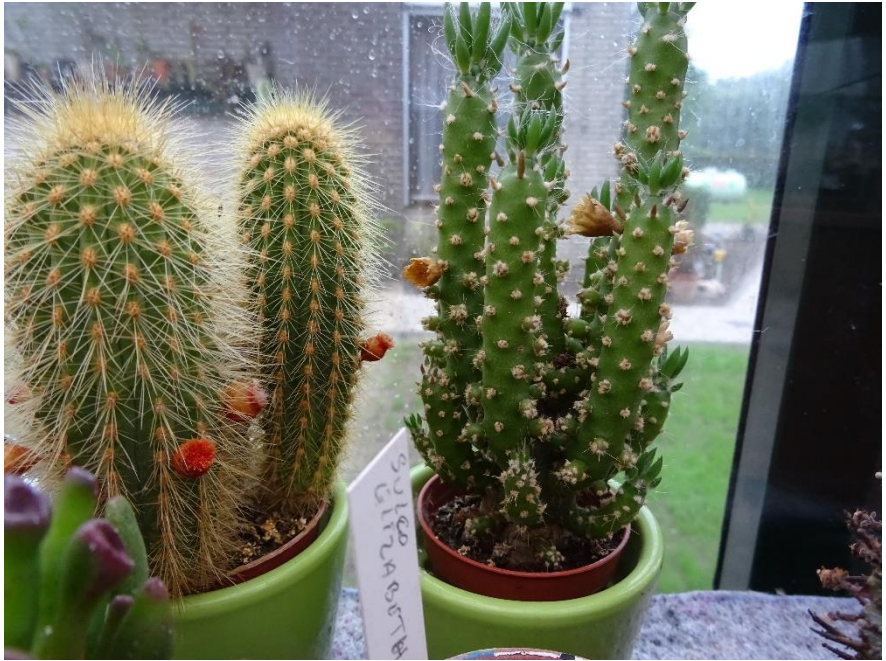
Hier klopt iets niet!