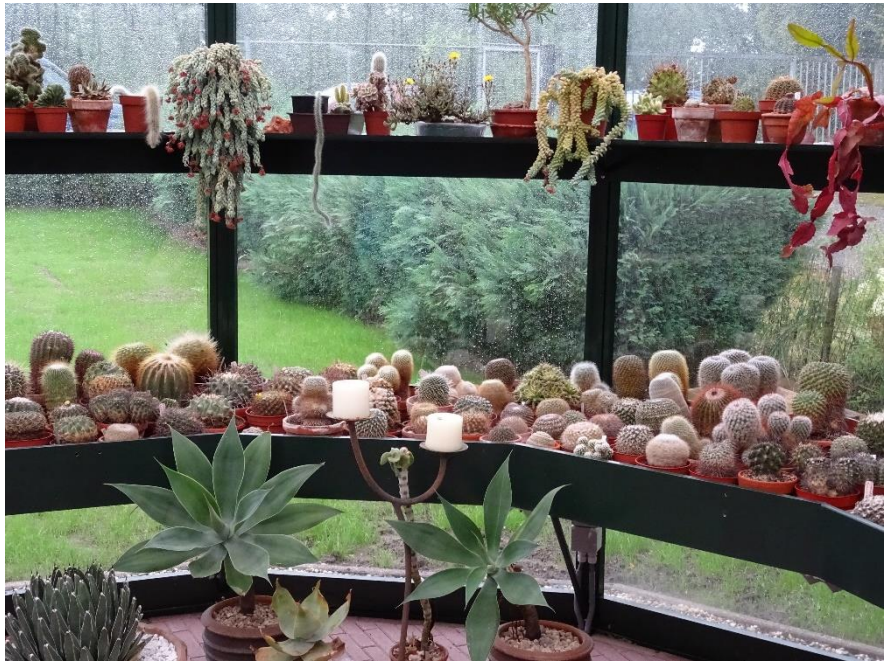
Prachtig rondom opgestelde planten in de kas