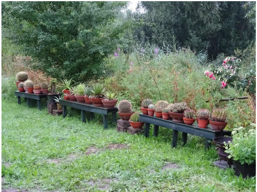
Planten buiten netjes op een rijtje