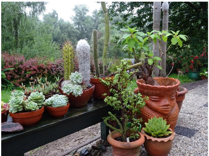
Een verstilld hoekje