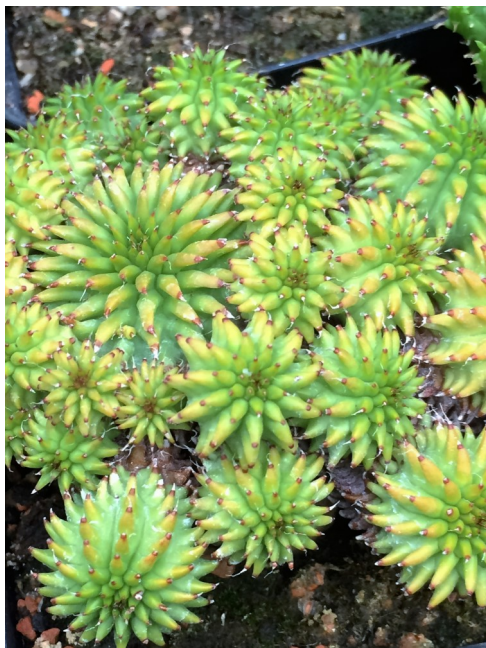
Mammillaria of Euphorbia?