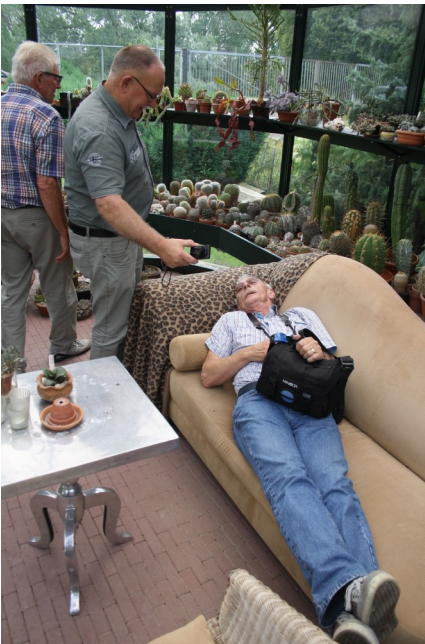
Bekaf bij het laatste adres!