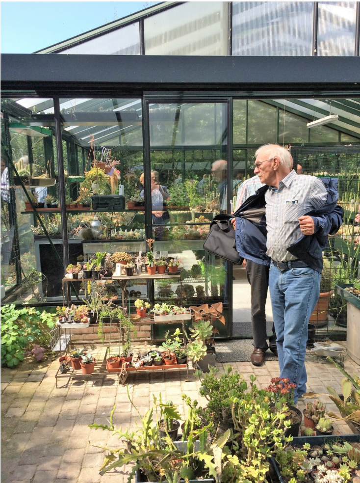
Ingang van de kas bij Theo

In ieder geval was het voor mij een echte vakantiedag!