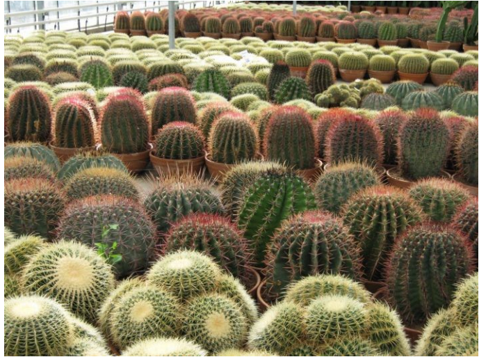
Ruim voldoende voorraad!