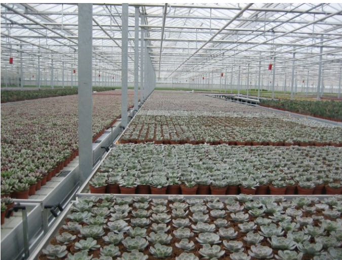
Eindeloze tabletten met vetplanten

verschillende kleuren en in alle maten van 1 cm tot wel 3 meter en bollen van meer dan 1 meter doorsnee. Een lust voor het oog. Je kunt daar voor niet al te veel geld een leuk plantje kopen. Dat is bij de handelaren die vooraan in de