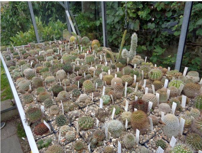
In de verzameling

te neemt om naar de open dag te gaan, kan ik zeer waarderen.