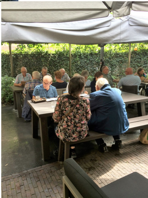
Aan de lunch

Aan alles is te zien, dat hij veel tijd besteedt aan de succulenten. Hij heeft een uitgebreide verzameling cactussen en andere succulenten. Menigeen keek hier zijn ogen uit, want bijvoorbeeld zijn verzameling Astrophytums liet een enorme verscheidenheid aan vormen zien. Eigenlijk was de tijd hier te kort om