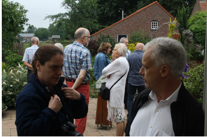
In Linden was er genoeg uitzicht en ook buiten viel er veel te zien.

De laatste jaren rijden de deelnemers niet meer in "colonne". Dat is het voordeel van de moderne navigatiesystemen: iedere chauffeur kan gemakkelijk de