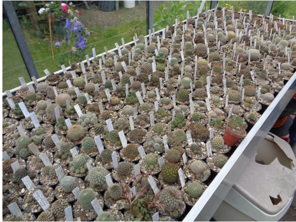
Een ander deel van de verzameling

Het praten ging de man heel goed af. Je hoefde alleen maar te luisteren, hij bleef maar vertellen over de manier