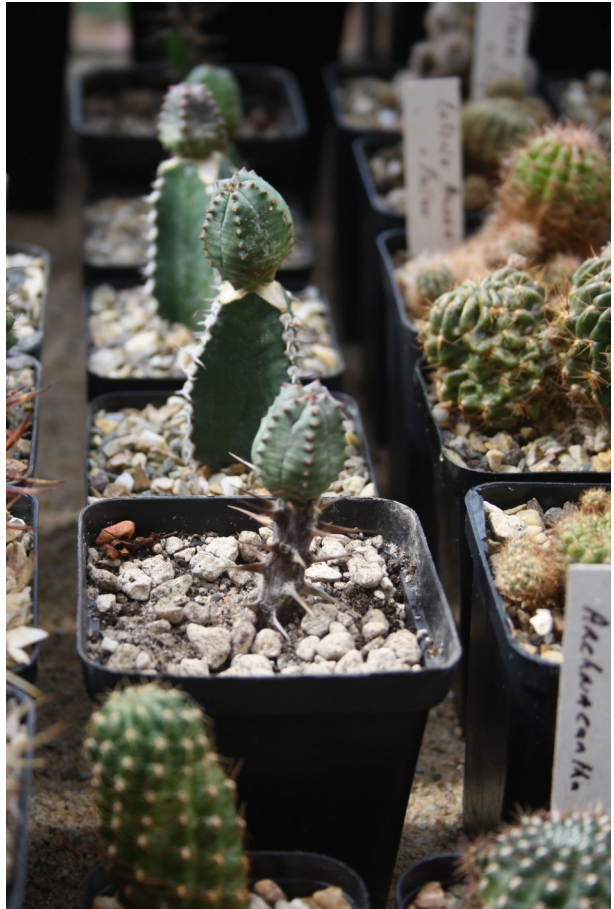
Een drietal zelf geënte Euphorbia's

De laatste twee jaar wel regelmatig gezegd ik ga proberen Euphorbia's te enten. Nu bij de laatste open dag bij Ubbink een aantal entstammen gekocht welke ik samen met andere entstammen ga gebruiken. De entstammen die ik al heb, zijn simpele E. milli 's. Die van Ubbink waarvan ik de naam niet weet zijn wat sneller groeiende en wat stevigere planten. Tevens enkele spruitende bollekes meegenomen. Kleine investering slechts enkele euro's. Er is wel een klein bijkomend probleempje. Ik heb nog nooit geënt. De theorie ken ik uit de diverse boeken. Als gezegd zelf een iets geschreven over Euphorbia's. Ach,