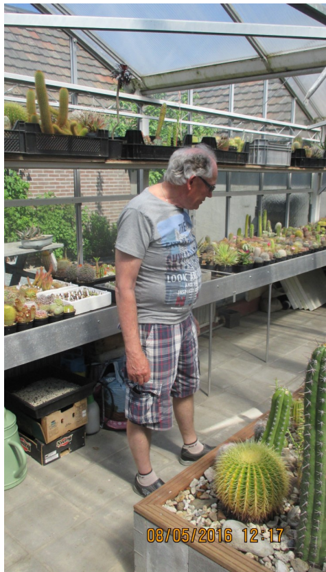
Jac's kas kritisch bekeken door een andere liefhebber uit Horst!

Wat ikzelf leuk vind is het feit, dat de mensen de opbouw in een rotsformatie, waarin ik mijn planten heb staan, zo mooi vinden.