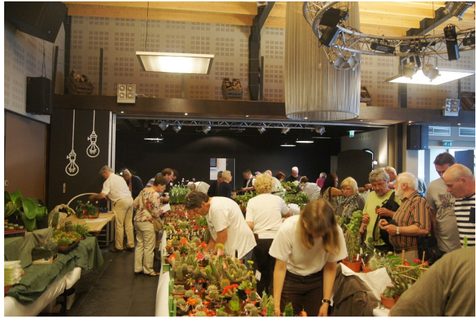
Vaak was het gezellig druk.

ders waren afkomstig uit België, Duitsland en Nederland. Vooral succulenten waren er te vinden, maar ook diverse orchideeën en rotsplanten. Hier en daar werden ook producten als voeding,