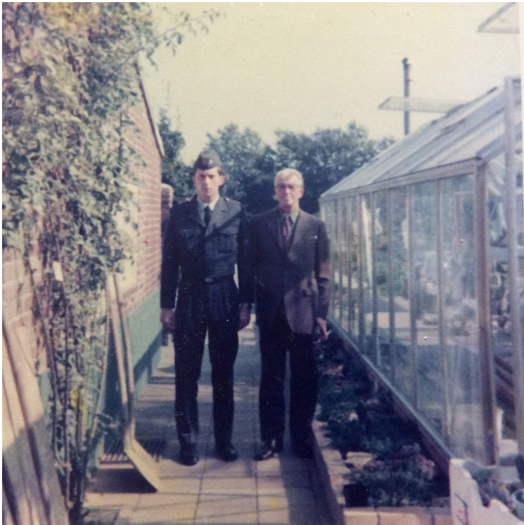
De schrijver met zijn vader 40 jaar geleden.

Het bleek te komen door een Echinopsis die daar met een witte bloem stond te bloeien. Toen ik mijn moeder hierop attendeerde vertelde zij mij dat deze cactus al jaren bloeide.