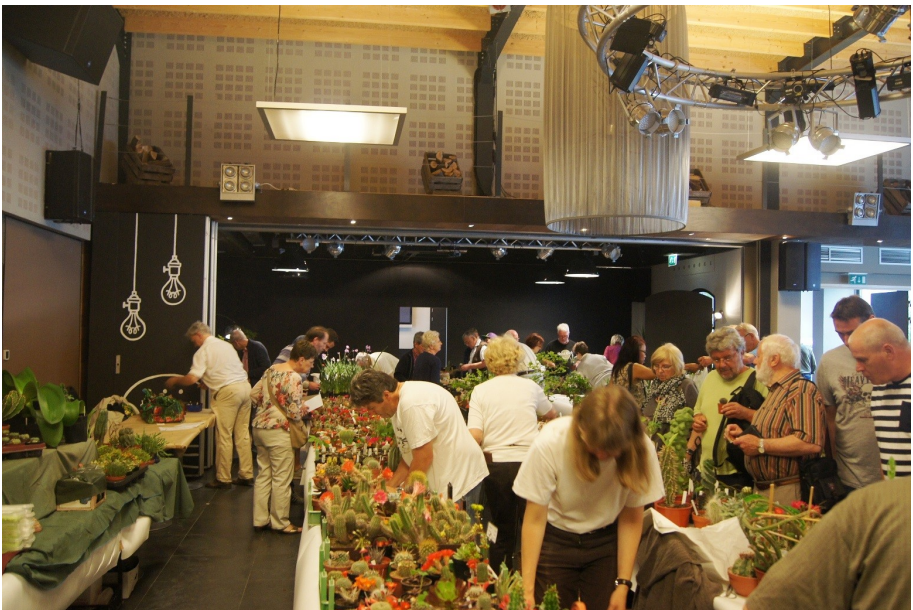
Soms was het zelfs dringen itussen de tafels!

Dank aan de mensen, die door hun inzet, dit gebeuren nu al verscheidene jaren mogelijk maken!