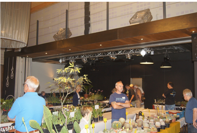
Hier moest de grootste drukte nog komen!

De afdeling had een stand waarin propaganda werd gemaakt voor de succulenten. Men kon er een aantal verenigingsartikelen kopen. Er werden vragen beant-