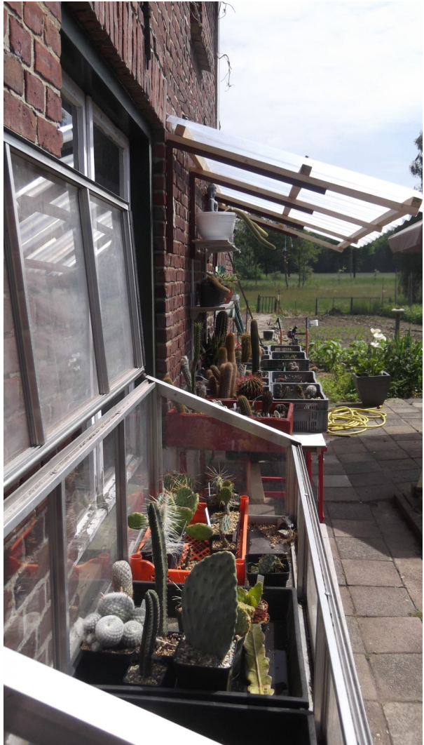
De huidige opstelling van de planten in de zomer. In de winter staan de planten binnen.

Jammer dat ik geen foto's meer heb uit deze tijd alleen deze nog waar men de kas ziet zonder centrale verwarming. De houten kas en aluminium kas hebben nog lang dienst gedaan als koude kas.