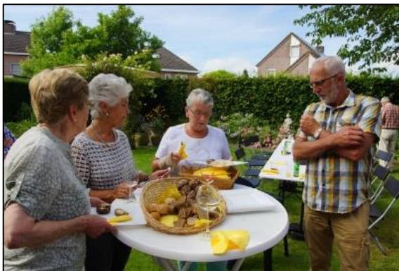
Gezellig samenzijn .....

Waar kun je uitgebreid "all you can eat" genieten voor de prijs van deze barbecue. En dan ook nog een heerlijk dessert van vruchten met ijs en (veel) slagroom. Wat kunnen we meer doen dan onze gastvrouw en gastheer bedanken voor alle moeite die ze steeds weer doen om het ons zo goed naar de zin te maken. Met deze perfecte barbecue, het toch weer zeer aangename weer, en het prettige gezelschap was dit weer een zeer geslaagde middag/avond. Het is toch elke keer weer leuk om ook die partners achter die leden die we elke maand zien te ontmoeten. Het zorgt er ook voor dat het niet steeds weer alleen over cactussen (en andere succulenten) gaat.