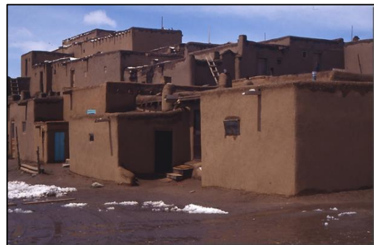
Adobe huizen in Taos Pueblo