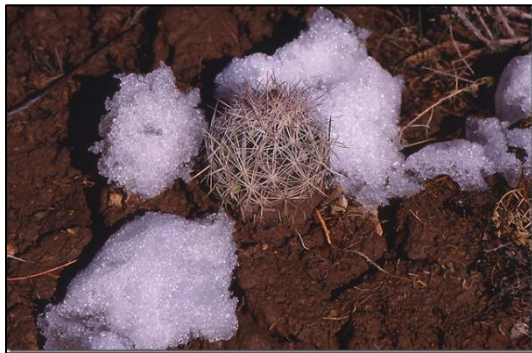
Coryphantha vivipara var