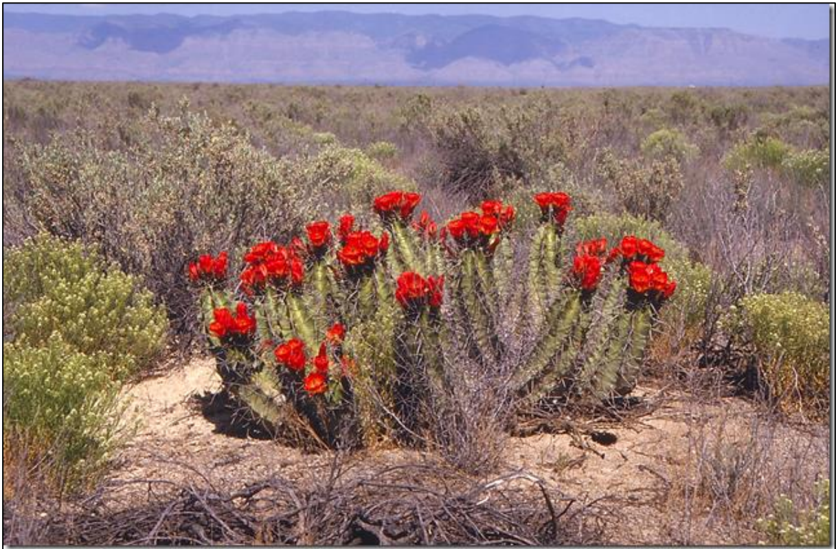
Echinocereus triglochidiatus v. gonacanthus