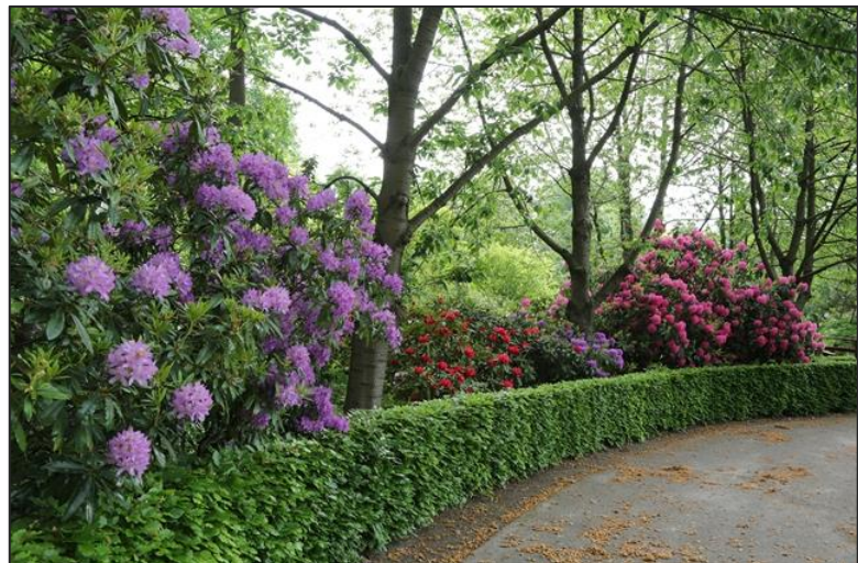
Bloeiende rododendrons in het arboretum

Maar we werden onverbiddeijk weer richting Mimi gedirigeerd die ons rond 11:15 uur moest afzetten voor de deur bij de welbekende Cok Grootscholten. Hier zouden we namelijk ook de lunch nuttigen. De meeste mensen waren al eerder bij Cok geweest en dus zwermde iedereen