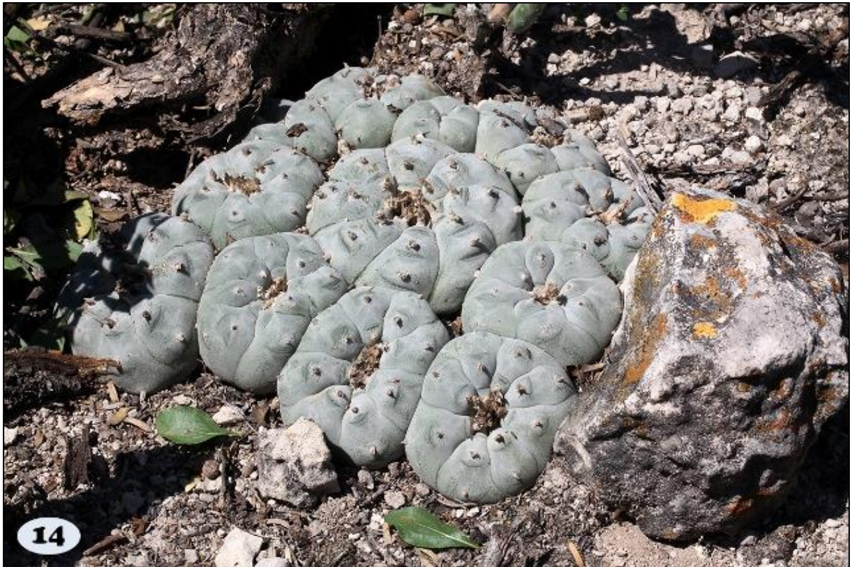
Eerste plaats: Lophophora williamsii gemaakt door Andre van Zuijlen