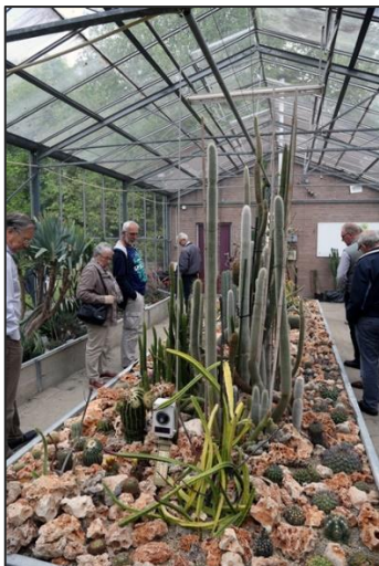
Kas van de afdeling West-Brabant in het arboretum Oudenbosch