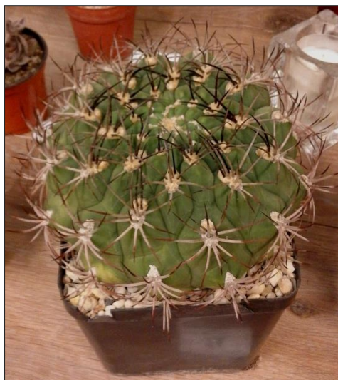
3 e prijs Arjan den Boer met 163 punten Gymnocalycium