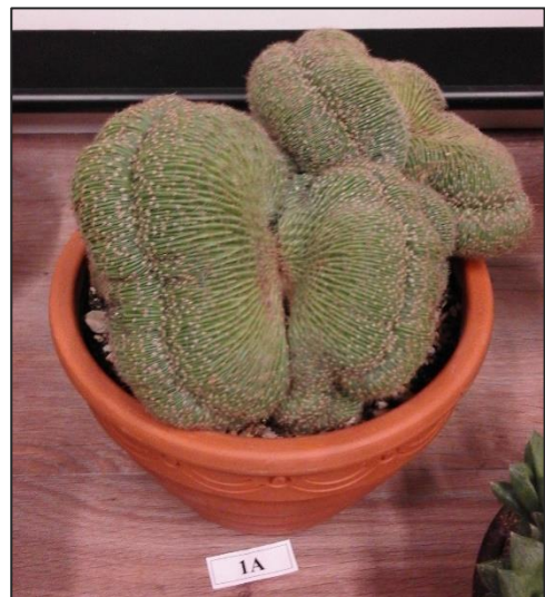
2 e prijs Frans Mommers met 166 punten Echinopsis spec cristata