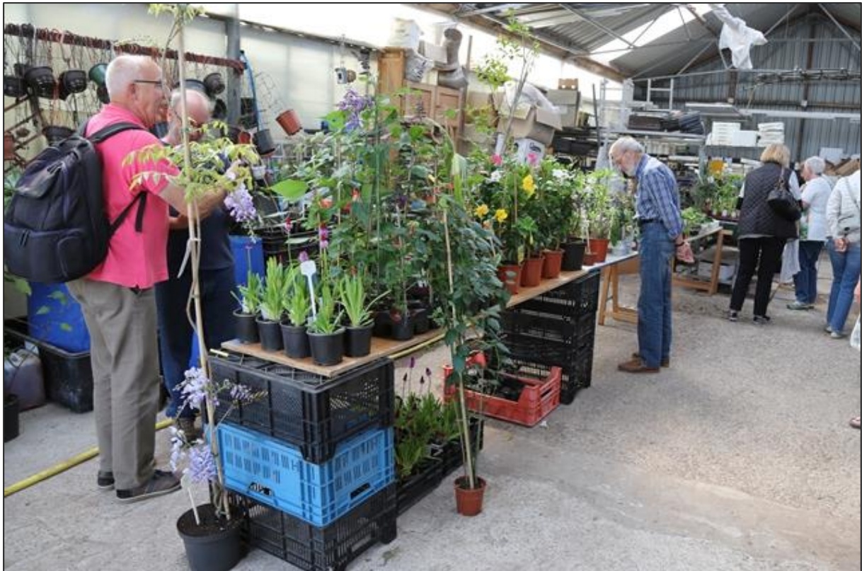
De verkoopruimte in de kas van Paul

persoonlijke dingen in de bus achter te laten, maar zou er geen moeite mee hebben als we wat plantjes zouden laten staan.