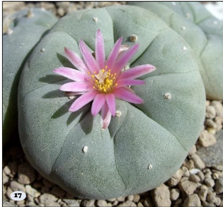
Derde plaats: Lophophora williamsii gemaakt door Arjan den Boer