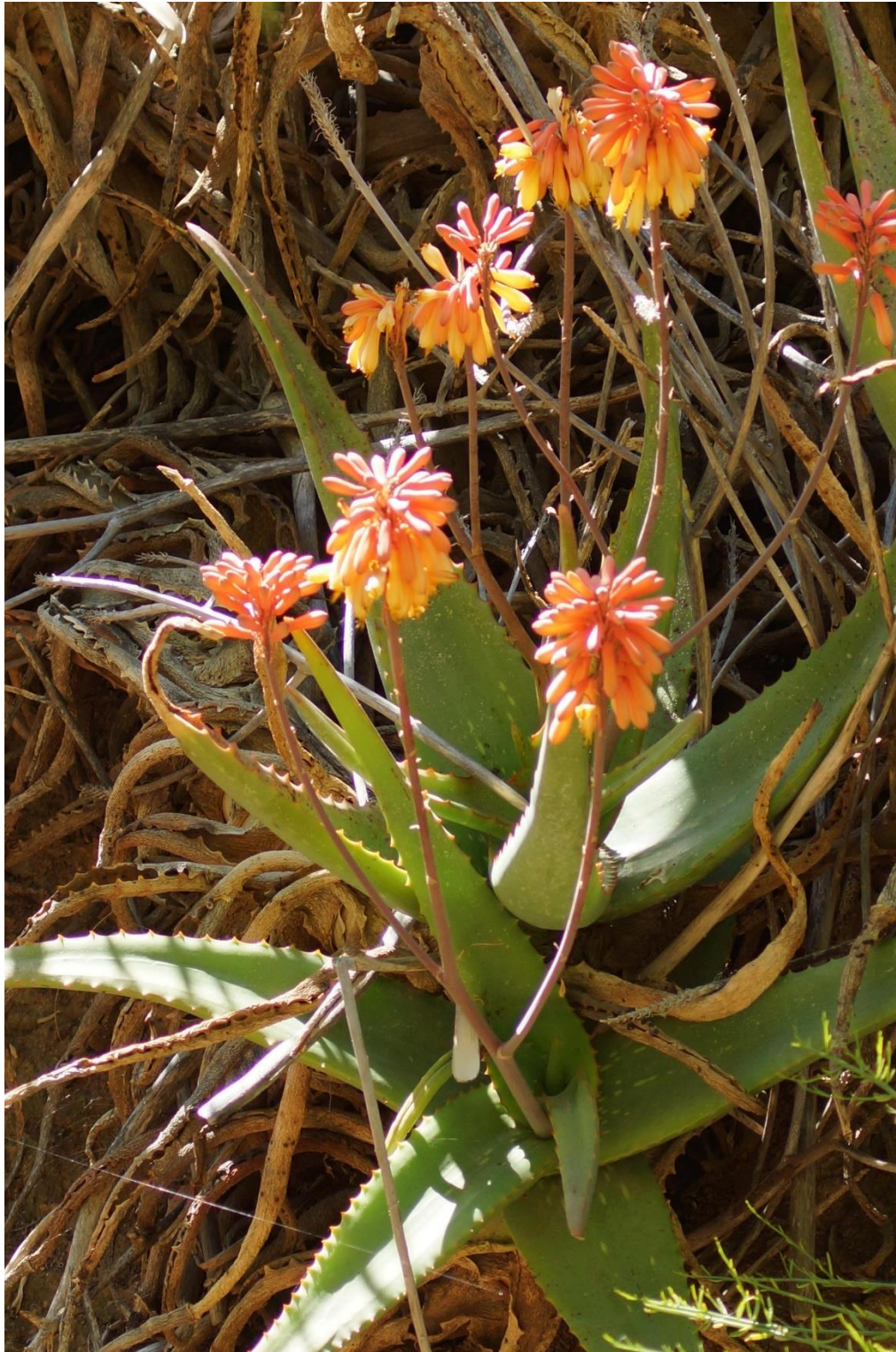
Aloë, Kleine Karoo, Zuid-Afrika

Verenigingsblad van de afdeling Gorinchem - 's-Hertogenbosch van Succulenta