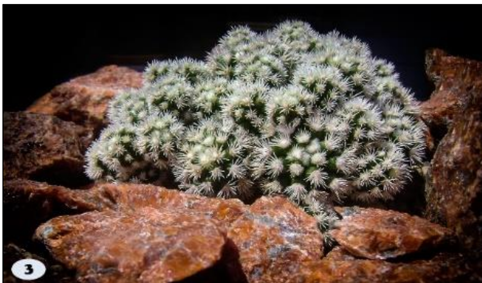
Tweede plaats: Mammillaria gracilis gemaakt door Arie Adriaanse