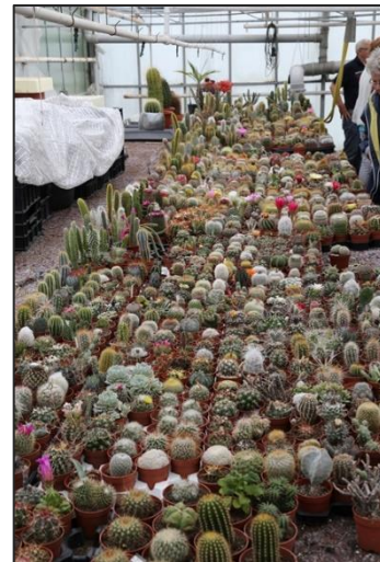
De privéverzameling van Jan de Vreede

grotere tegenstelling met het vorige bezochte adres is nauwelijks denkbaar. Waar het bij van Zanten schoon en georganiseerd is, is het bij Paul gewoon een zootje. Zoals hij zelf toegeeft kan hij niets weggooien en dus zit alles tot de nok toe vol. Zijn verzameling is compleet dichtgegroeid en ook