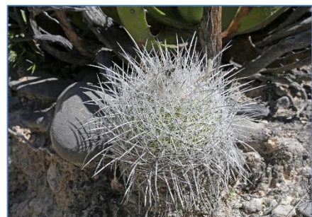
Thelocactus conothelos argenteus

De volgende reden van Doctor Arroyo via La Ascension naar Galeana. Een stop bij Soledad leverde weer een rijkdom aan cactussen op met ca. 10 verschillende soorten. De mooiste vondst van de dag was echter op een heuvel tussen La Ascension en Galeana. Hier groeiden talrijke prachtige planten van Thelocactus conothelos argenteus , de ene nog witter bedoornd dan