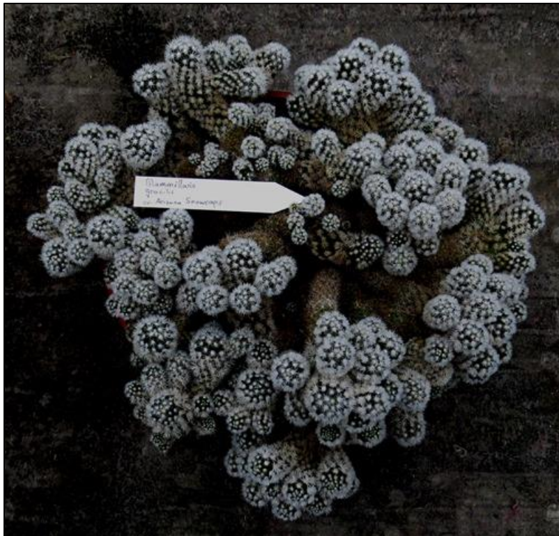
Mammillaria gracilis cv Arizona Snow Cap