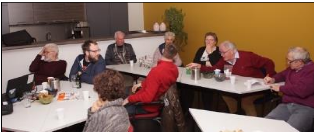
Er was weer veel discussie