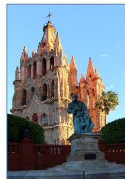
De kathedraal in San Miguel de Allende

planten over het algemeen in zeer goede conditie. Via San Luis de la Paz reden we daarna een tiental kilometers zuidwaarts tot bij Mineral de Pozos. Na enige tijd zoeken vonden we hier dan toch een tiental planten van een van de kleinste mammillaria's, namelijk Mammillaria albiflora . Na deze zeer geslaagde laatste cactusdag kwamen we tenslotte aan in San Miguel de Allende, een behoorlijk toeristische stad. Met wat beelden van de stad, de gouden zonsondergang en de kathedraal in de schijnwerpers werd de lezing beëindigd.