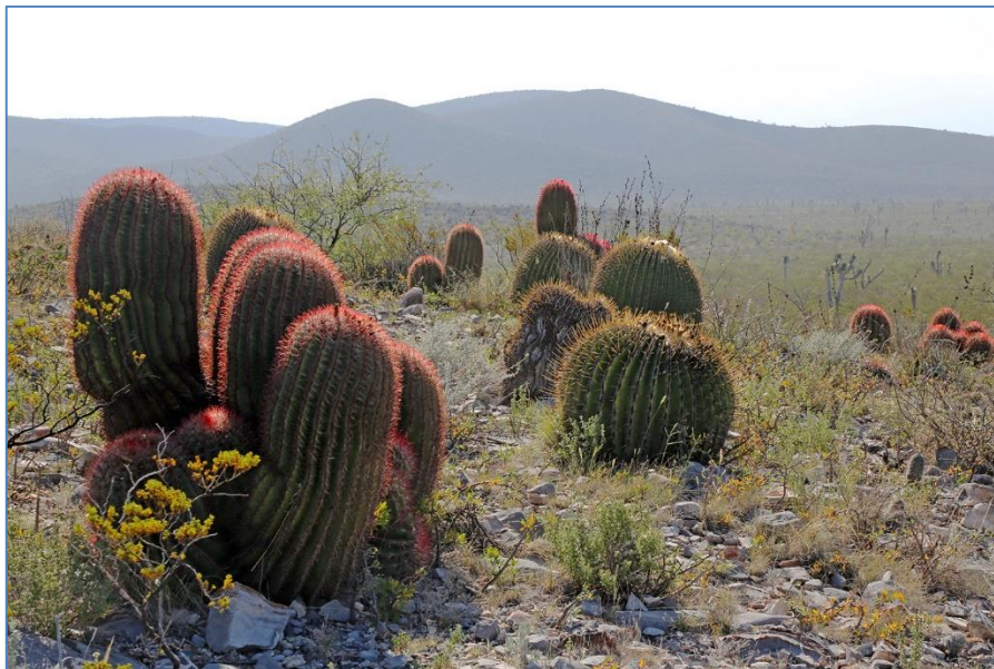
Niet te missen Ferocactus pilosus met Echinocactus horizontalis

Voor de volgende plekjes gaan we een stuk noordelijker en komen dan uit in Doctor Arroyo in de staat Nuevo Leon, wat op gelijke hoogte ligt met Matehuala in het noorden van San Luis Potosi. In Doctor Arroyo bleven we een paar dagen om hier de omgeving eens goed te verkennen. De eerste dag ging richting Mier y Noriega en een van de eerste stops hier leverde maar liefst 13 verschillende soorten cactussen op, waaronder drie thelocactussen. En een eind verderop zagen we de eerste van vele Ferocactus pilosus , die soms overheersend in het landschap aanwezig zijn.