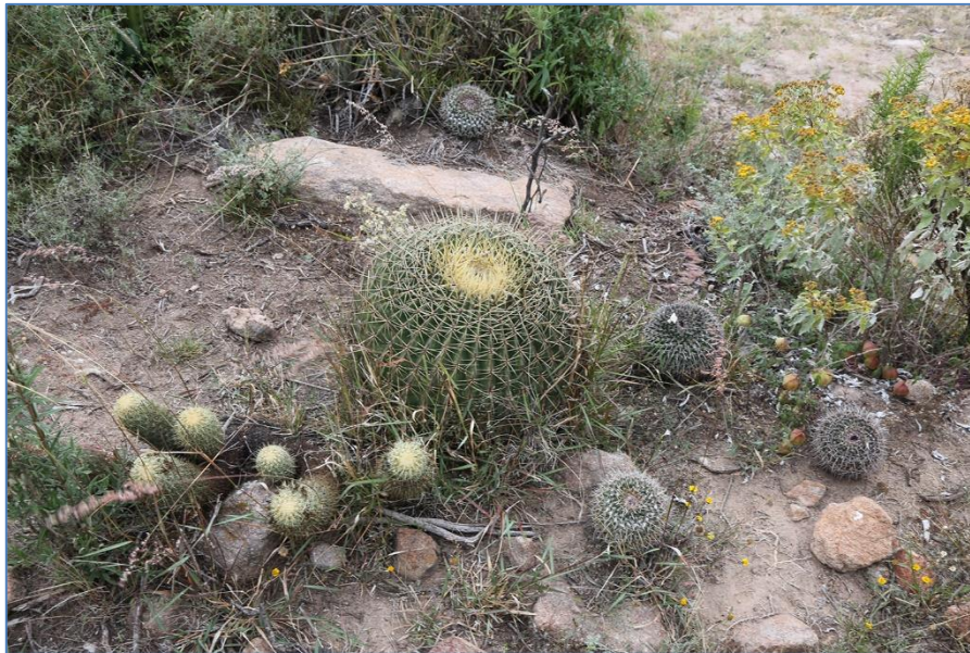
Ferocactus histrix , Coryphantha erecta en Mammillaria pettersonii

als snoepje, wat wij minder geslaagd vonden, want wij wilden liever de zaadjes. Het kostte ons veel moeite hier weg te komen, want moeder ging koffiezetten en allerlei lekkere dingen voor ons klaarmaken.