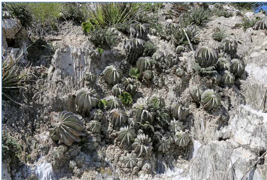
Een wand vol met Aztekium hintonii

Ook in Galeana bleven we een paar dagen om ook hier de omgeving eens wat beter uit te kammen. De eerste dag was een speciale. Via Pozos zouden we de rit naar San José del Rio maken. Ondanks de relatief korte afstand hadden we hier toch een hele dag voor uitgetrokken. In de omgeving van Pozos werd een plek bezocht waar we mooie plantjes van Gymnocactus beguinii vonden. Ook zagen we waar de lokale bevolking hier van leeft, vooral van geiten, en zagen hoe op zondagmorgen buiten een varken werd geslacht. Vanaf Pozos zochten we het weggetje naar San José del Rio en na precies 17,7 km stopten we bij een kloof aan de rechterkant van de weg. Na enig zoeken, het kloofje links van de helling was grotendeels weggespoeld, vonden we iets hoger op dan toch volop planten van Geohintonia mexicana en Aztekium hintonii . Op deze plek brachten we enkele uren door met het bekijken en fotograferen van de vele planten hier.