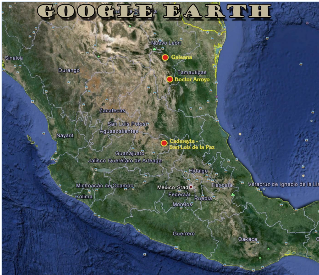
De tijdens de lezing besproken plekjes in Mexico