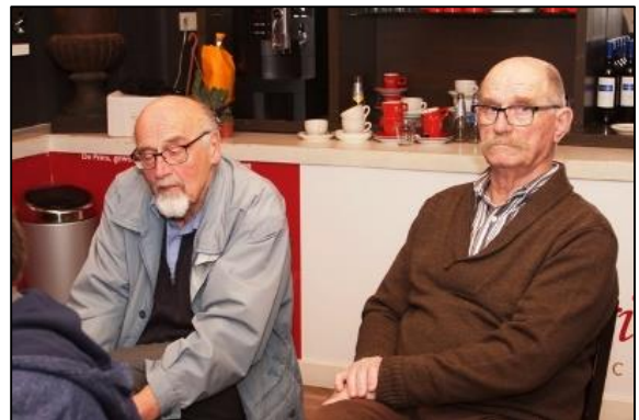
De belangstelling was groot