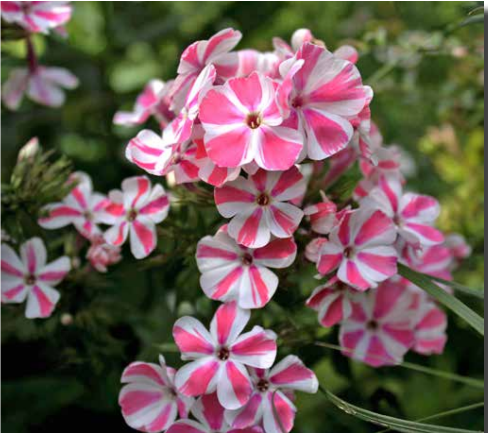
Phlox 'Peppermint Twist'.