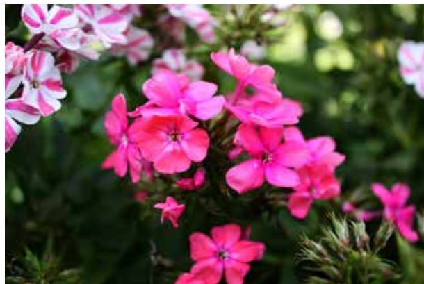
Phlox pan. 'Peppermint Twist' met sport 'Pink Attraction'

den gerooid en in de afvalcontainer gedaan, niet op de composthoop. Plaats op de vrijgekomen plek gedurende 2 jaar geen Phloxen. Om meeldauw enigszins te voorkomen zorg je dat de plant een luchtige standplaats heeft, zodat er wind tussen de stengels kan komen.