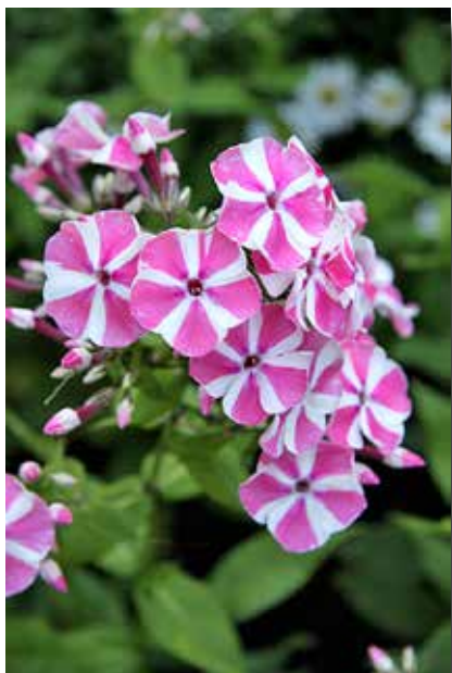
Phlox pan. 'Peppermint Twist'