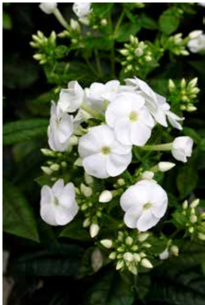
Phlox pan. 'Danielle'