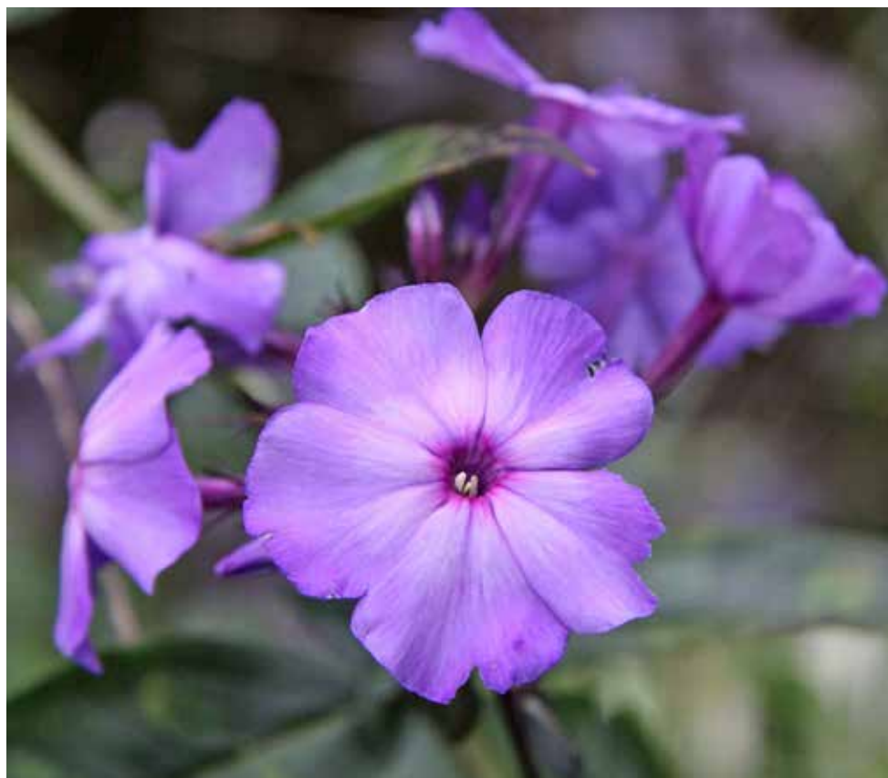
Phlox paniculata 'Blue Paradise'