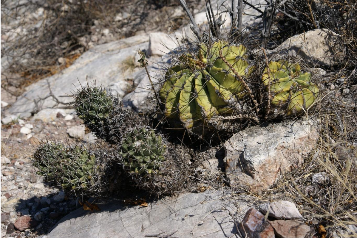
Ferocactus echidne en Coryphantha octacantha

Iets over 8 uur rijden we van Metztitlan naar San Cristobal, hier klimmen we het grote dal uit naar Metznoxtla, over de bergrug heen dalen we dan af naar San Pablo Tetlapajac, boven de rivier kijken we nog wat rond en noteren M. magnimamma en longimamma , Fero echidne en Cor. octacantha , hier groeien de cactussen zelfs op de bomen. We steken de Rio Amajac over en klimmen de volgende bergrug over, hier vinden we Gymnocactus horripilus ,