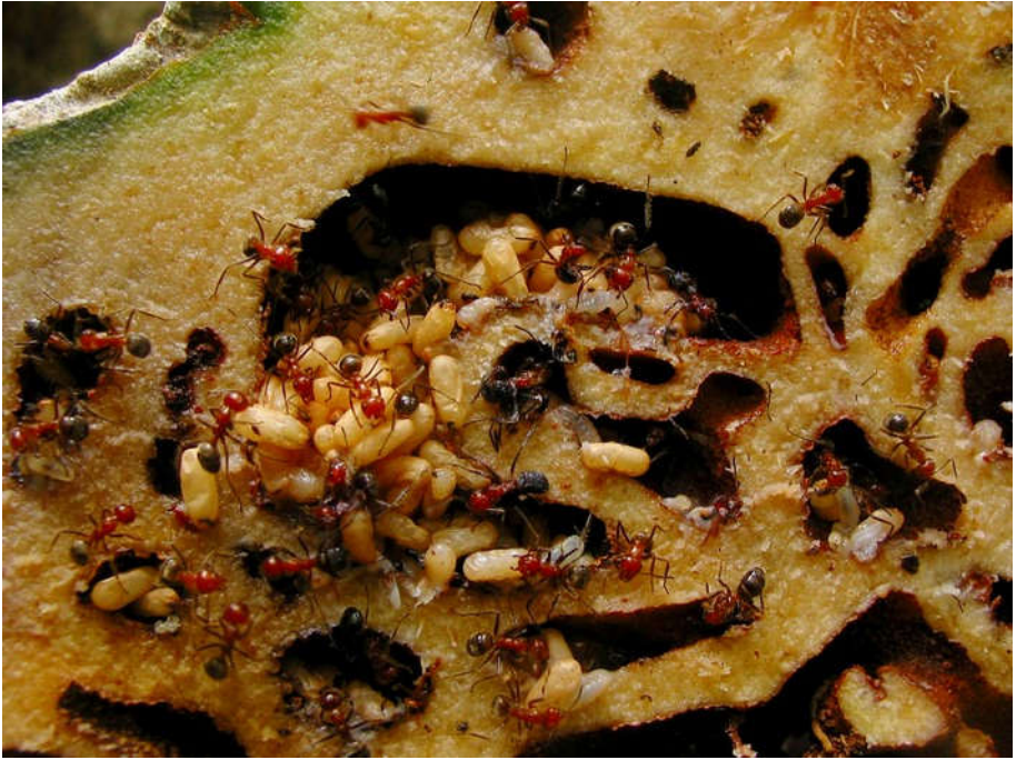
Hydnophytum formicarum - mieren