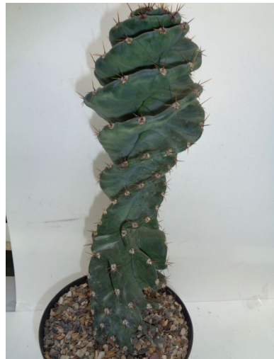
Cereus peruvianus tortulosus

deze rechtop staande zuilvorm. Met zijn zilverwitte harige bedoorning. Alleen is de monstrueuze vorm veel minder bedoorn. En groeiend in de hoge berggebieden van Bolivia en Argentinië boven de 3000 meter. En wat dacht u