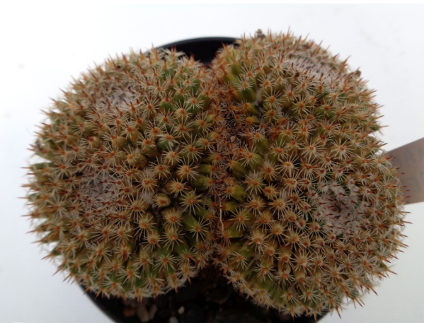
Mammillaria perbella 1

chotomie of gaffel-vormige vertakking als beide takken van gelijke grootte zijn. Bij ongelijke grootte spreekt men van Anisotomie. Bij dit verhaaltje heb ik ook