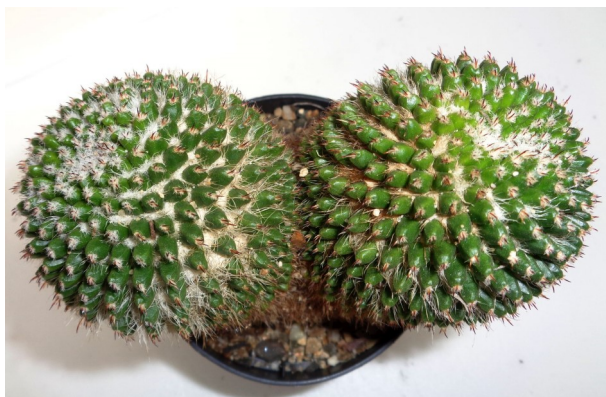
Mammillaria perbella 2

Daar heb ik nog maar een plant van. Maar die heeft meer witte haren tussen de be-doorning. Deze is enkele jaren geleden al gedubbeld en doorgroeid. Maar begint nu toch weer die verbreding in de kop te krijgen als teken dat hij weer opnieuw gaat