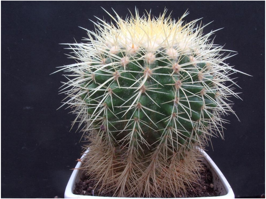
De geadopteerde vondeling in 2013