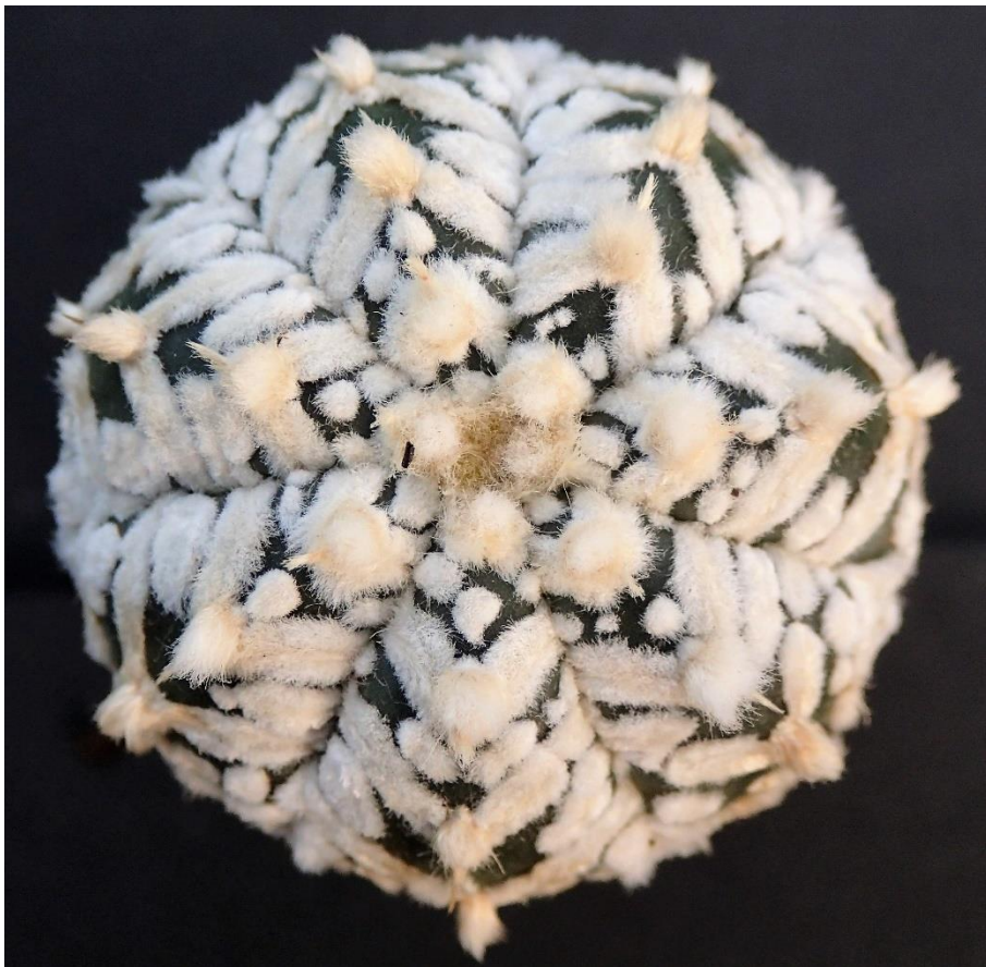
Astrophytum asterias 'Superkabuto' Zebra type (ook wel V-type of Fly's Wings type of Tiger genoemd).