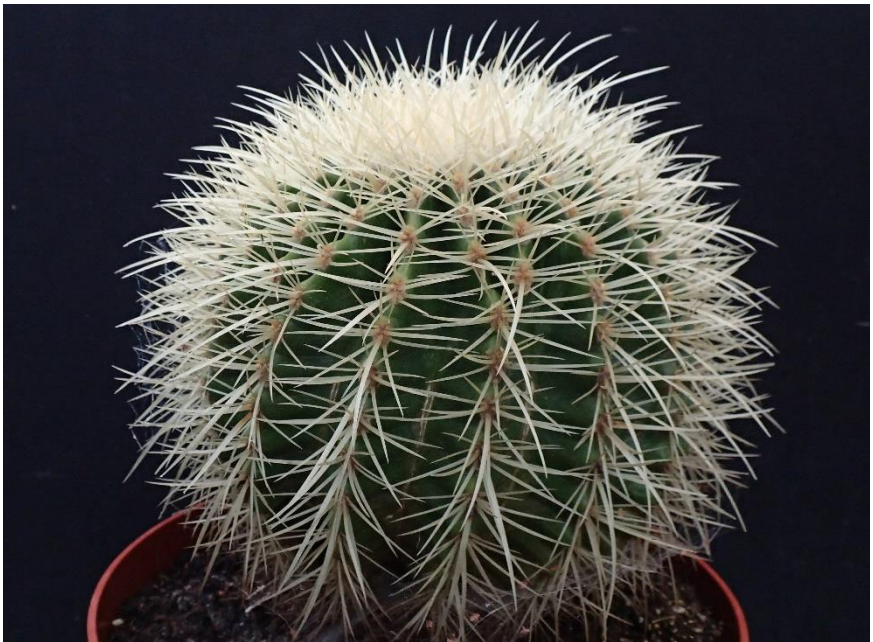
In 2017 na het verpotten. De plant is hier ongeveer 20 cm hoog en breed.