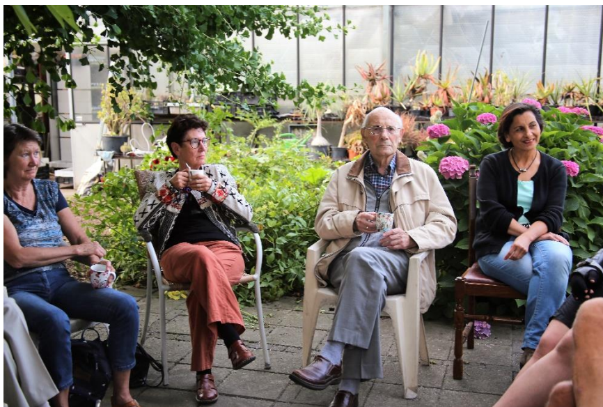
In een kring bij de notenboom

Het vorige succesvolle kasbezoek was bij Andre van Zuijlen en hij nam de uitnodiging van Ludwig aan om ook bij hem te