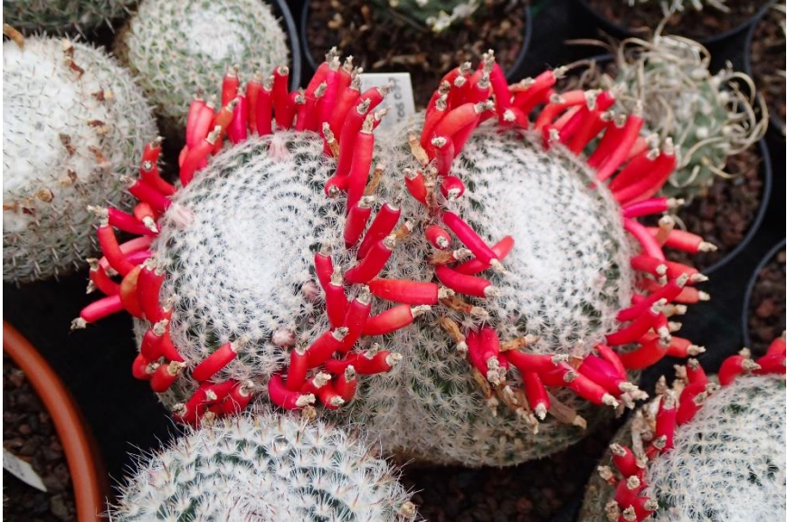
Mammillaria perbella in de cactuskas