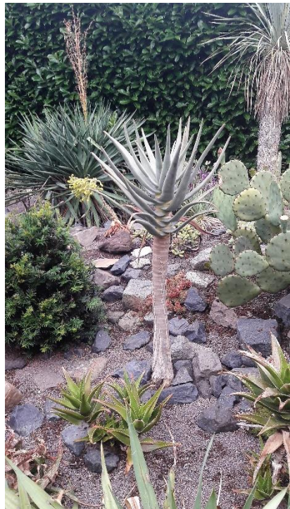
Nog een kijkje in de tuin (foto Riet)

Bloeiende opuntia in de tuin (foto Riet) bewonderen. Andre vertelde dat door de warme dagen een opuntia (naam?) met oranje-rode bloemen beter bloeide dat andere jaren. Mooie gave agaves, allerlei al dan niet winterharde vetplanten in een langwerpige tuin aan beide zijden met hagen afgeschermd. Veel planten verhuizen in de winter naar de kas en komen dan onder de schappen te liggen. Heel veel is er te zien. Nadat ik dit stuk tuin het dichtst bij het huis had bewonderd maar eens naar helemaal achterin gelopen. Daar een hele tijd staan kijken naar alle bessenstruiken, door een groot net afgeschermd voor de vogels. Bessen volop! Een vogeltje wist blijkbaar een in en uitgang. Goede keus: bessen waren rijp! Andre vertelde dat hij