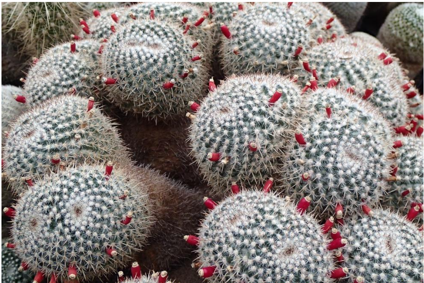
Mammillaria parkinsonii in de cactuskas