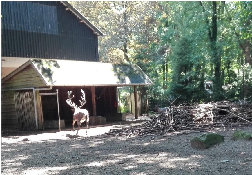
Bosrendier met imposant gewei

We bezoeken de Desert (warm!!), kijken daarna onze ogen uit naar een mannetjes rendier. Zijn gewei is immens groot. Hoe kan hij dit dragen vragen we ons af. Geboeid blijven we hem een tijdje observeren.