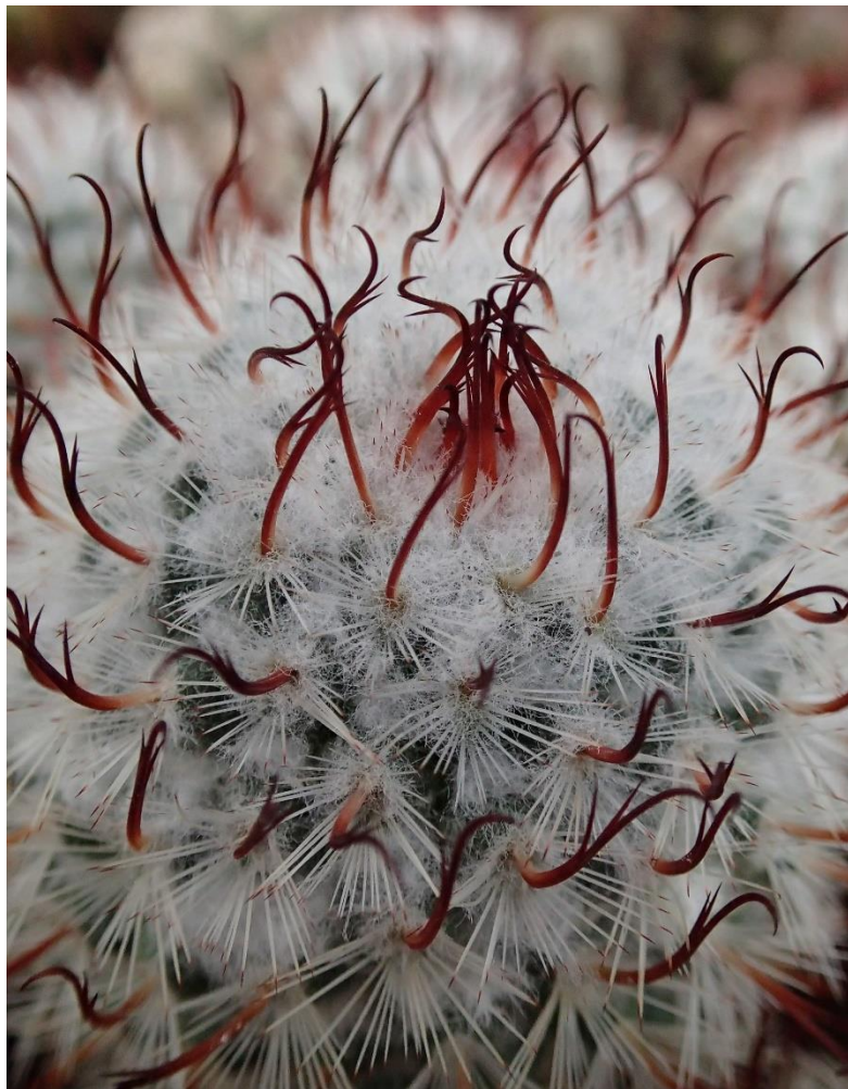
Een Mammillaria bombycina met gespleten doorns in de kas van Andre van Zuijlen.