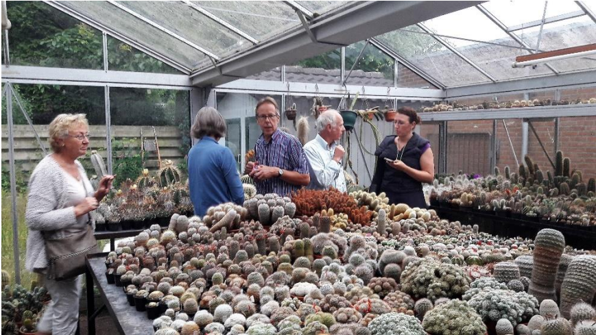
In de cactuskas

er wijn van maakt. Vervolgens de beide kassen bewonderd. Wat een grote collectie. De vetplanten die eertijds door Ciska werden verzorgd stonden er prima bij, evenals de kas met een grote collectie Mammillaria's. Door de grootte van tuin en kassen konden we gemakkelijk overal rustig kijken. Er waren in totaal 15 bezoekers.