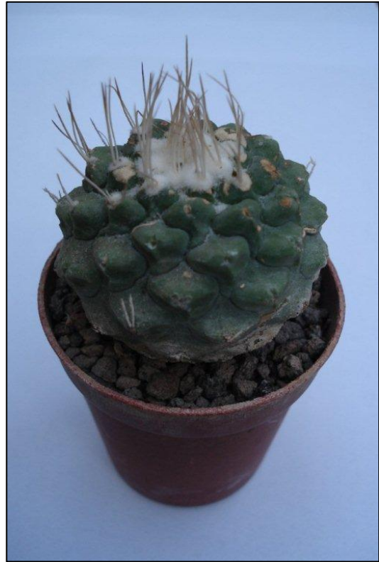
plant van de maand Strombocactus disciformis