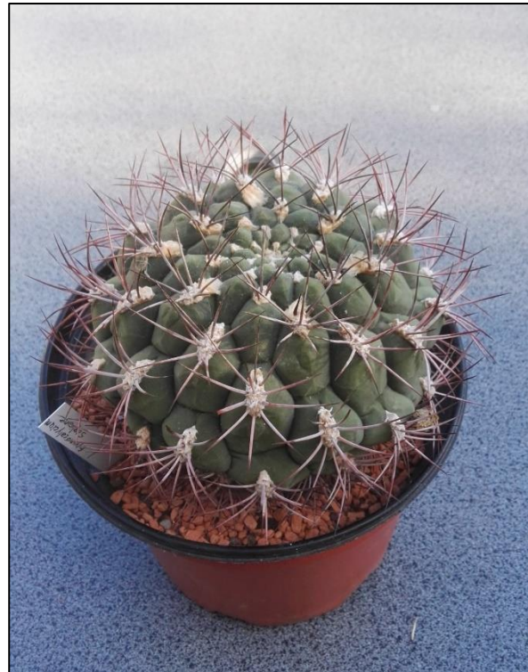
Loterijplant van de maand: Gymnocalycium saglione