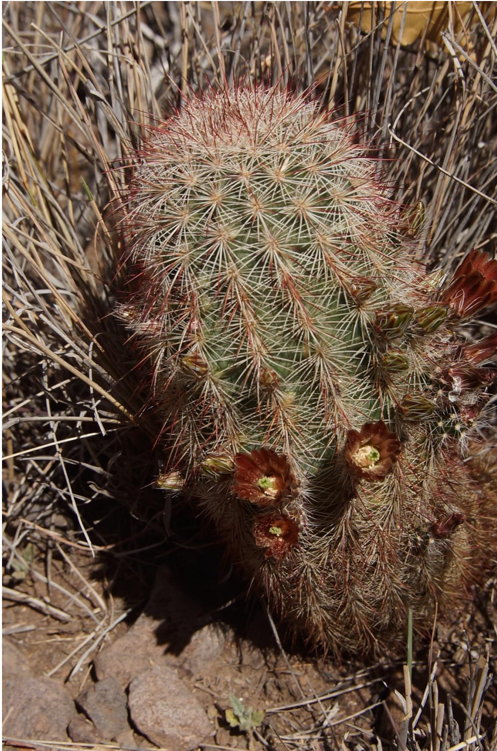
Echinocereus russanthus , Big Bend National Park USA

Verenigingsblad van de afdeling Gorinchem - 's-Hertogenbosch van Succulenta