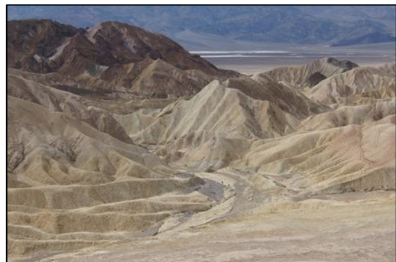
De Death Valley

Yoshua Tree op de foto werd gezet, ging het naar de Death Valley. Mooie gekleurde bergen, zandduinen, de woestijn in bloei, Badwater Basin, maar vooral de eerste cactussen van deze reis: Echinocereus engelmannii , Cylindropuntia , Opuntia basilaris en Echinocactus polycephalus .