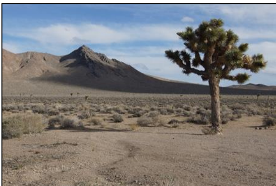
De eerste Yoshua Tree

Om ca. 8.45 uur begon Frans met zijn lezing "I Love ...." over zijn reis met Tonny naar Zuidwest-USA. In vier weken werd bijna 9000 km afgelegd door 6 staten en 20 nationale parken. Omdat Frans ze allemaal noemde, heb ik ze ook allemaal in het verslag verwerkt. Vanuit San Francisco werd in de regen eerst naar het Yosemite Park gereden, waar ze echter met hun auto niet in mochten. Dan maar door naar het Sequoia Park, waar in de sneeuw de tot 83 m hoge bomen met een omtrek tot 31 m werden gezien. Via de Red Rock Canyon, waar de eerste