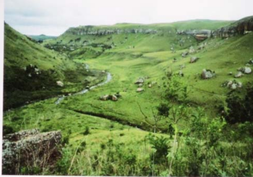
Giant Castle is oudste reservaat van Zuid Afrika

Hij begint met de route van de reis aan te geven op een landkaart, en vertelt erbij dat je niet zomaar Lesotho in kan gaan daar er nog steeds