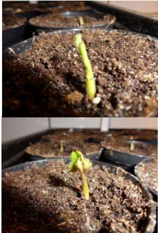
En hier zijn ze echt zaailing geworden