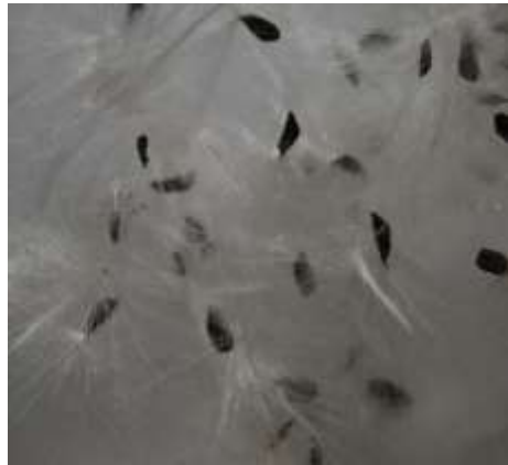
Zaden van Ceropegia stapeliiformis

Een behoorlijk deel van de pluizige zaden hing nog in de plant echter een behoorlijke hoeveelheid had precies gedaan wat moeder natuur in gedachten had. Zachtjes weg dwarrelen en elders landen. Ik heb uiteindelijk een kleine 60 zaden verzameld van deze ene peul.