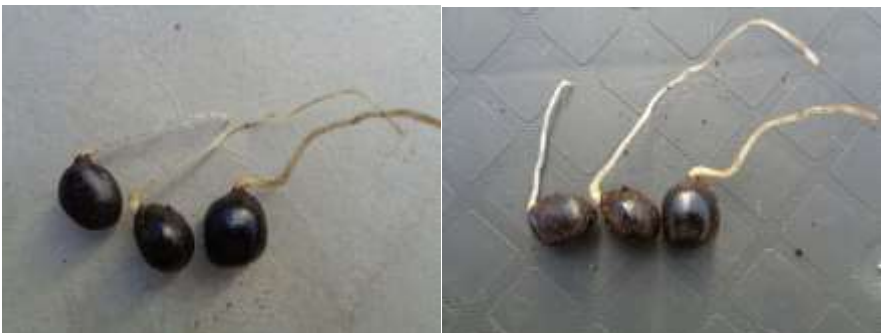
Ontkiemde zaden van de pioenroos

Hij zegt "ik zal je er wel wat komen brengen, als ze rijp zijn". Het was de zomer van 2014. Later dat jaar kwam hij, zoals was afgesproken, de zaden brengen. Het waren 40 zaden.