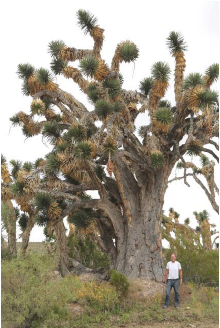
Een giga Yucca filifera