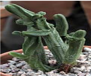
een andere Crassula pyramidalis